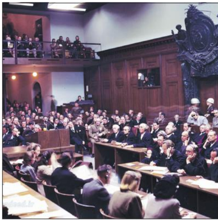
دادگاهی برای محاکمه دشمن - این عکس، مربوط به دادگاه نوربزرگ است. از متهمان در این دادگاه شرکت نکردند؛ از جمله این دادگاه بعد از پیروزی متفقین برای محاکمه ۲۱ تن از سران آلمان نازی توسط آمریکا، انگلیس، شوروی و فرانسه تشکیل شد. با این همه، بسیاری از متهمان در این دادگاه شرکت نکردند؛ از جمله هینرله که قبل از رسیدن نیروهای دشمن، خودکشی کرد.