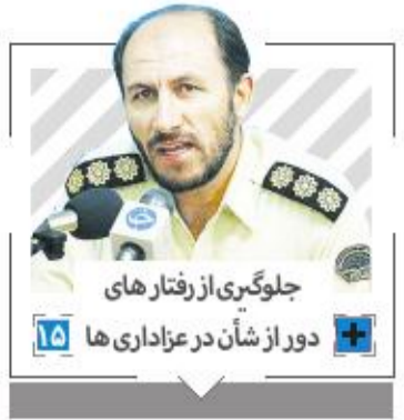
جلوگیری از رفتار های دور از شأن در عزاداری ها

دوشنبه ۱۲ مهر ۱۳۹۵ ۱ محرم ۱۳۲۸ سال یازدهم | شماره ۴ | ۲۷۵۹ صفحه پرتیراژترین روزنامه استان اصفهان