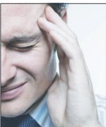
بیماری + پوست پوست

نیاز به مراجعه پزشک دارد تا سریعاً با داروهای لازم به بهبود فرد کمک شود. یکی از درمان های خانگی که بسیاری به کار میگیرند، و براین تصورند که دردشان را بهبود می دهد، استفاده از دود سیگار است که باید گفت چنین نیست و در واقع اگر هم فرد با این شیوه احساس تسکین کند، به دلیل گرم شدن گوش است و مسلماً چنین روشی، حال با هر چه باشد مثل حوله گرم یا عنبر نسا را خواه ناخواه باعث تسکین فرد می شود، اما در واقع کمکی خود به خودی است. اغلب دوره های این بیماریک تا تاخیر بیندازد. از این رو توصیه به درمان خانگی نیست و بهترین راهکار تشخیص سریع و درمان توسط پزشک است.