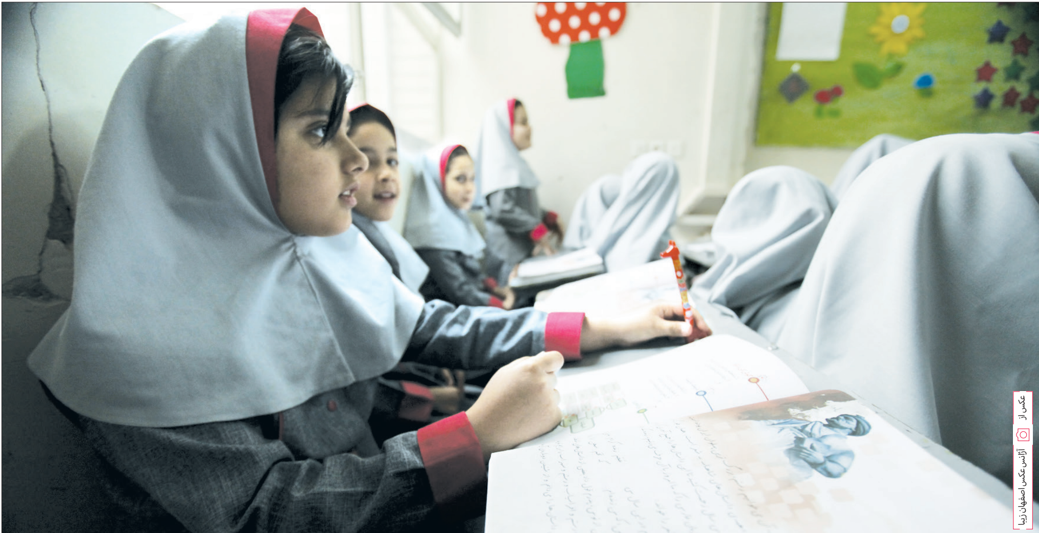
عکس از آگنس عکس اصفهان زینا

شده یک بار همزمان باشید؟! منبع: خبر آنلاین