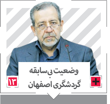
وضعیت بی سابقه گردشگری اصفهان