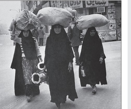
آوارگان جنگ در اهواز - دفاع مقدس