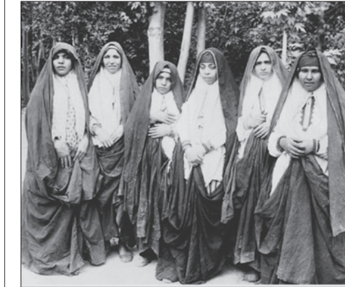
زنان چادری در زمان قاجار