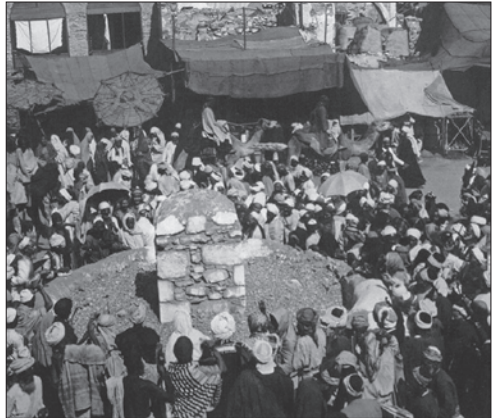
تصویر قدیمی از رمی جمرات