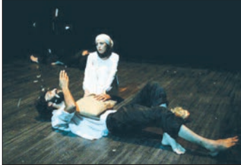
«...احساسی که زن نسبت به جسم خود دارد. اعتماد به نفس، ذهنیت او نسبت به دنیا، ترس های عمده و احساس گناه‌های او، چگونگی ورود او به روابط عاشقانه و چگونگی عملکردش در این حوزه و ... همه این ها، نشانه هایی از مادر اورا درپردارد.»

این ها بخشی از صحبت های رابرت جانسون است در توضیح عقده مادر در ادامه بحث یونگ درباره مادرانگی است. زن در ققامت یک مادر به واسطه تجمع ملغمه‌ای از عواطف واحساسات گوناگون، همواره دستمایه آثار زیادی قرار گرفته و یکی از مهم ترین ، تاثیربرآنگیزترین و ستودنی ترین این آثار «یرمای لورکاست.