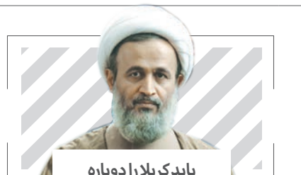
باید کر بلا را دوباره بشناسیم

ای کاش در ادارات، خرید کالای خارجی که مشابه داخلی دارد به کل ممنوع و با جریمه همراه می شد