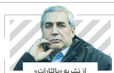
از نشریه «یالتارات» کم نواخته نشده ام!

رضایزدانی، خواننده: این روزها تبعات جنگ را در سوریه می بینیم که چگونه مردم این کشور از بیرون و بیرون گرفته تا بچه کشته می شوند و در سایه وحشت و ترس زندگی می کنند. حتی فکر کردن به جنگ تن آدم را می لرزاند چه برسد به اینکه دیگران شوی. می توانیم برای صلح ترانه و موسیقی تولید و منتشر کنیم. من ترانه «وطن یعنی...» را خوانده ام که نصف بیشتر آن درباره صلح است. در ترانه پرچم هم که برای کاروان المپیک ایران آن را خواندم، باز هم به این موضوع اشاره کرده ام. به خاطر جنس صدامی روی این گونه ترانه ها زیاد کاری می کنم.