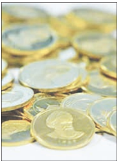
باگشت تاطی روزهای اخیر این نوع سکه از ثبات نسبی برخوردار باشد.

به گفته مسولان سامسونگ، حدود نیم میلیون از خریداران آمریکایی گلکسی نوت ۷ دیوایس خود را تا به حال تعویض کرده اند و همچنان ۵۰ درصد آنها، هنوز در حال استفاده از این محصول هستند. طبق اخباری که از این شرکت کره ای نقل شده است، تنها ۵۰ هزار نفر از این افراد، مجدداً نسبت به خرید گلکسی نوت ۷ تمایل نشان داده اند و سایرین، به سمت محصولات و برند های دیگر رفته اند. شاید معرفی آیفون ۷ و ۷ پلاس توسط کمپانی اپل که حدوداً چهار هفته بعد از رونمایی از گلکسی نوت ۷ بود، باعث به وجود آمدن این اتفاق شده باشد. در هر صورت، روند بازپس گیری گلکسی نوت ۷ همچنان ادامه دارد و سامسونگ می خواهد تا این مشکل را رفع و کرکره این پرونده را برای همیشه پایان بکشد.