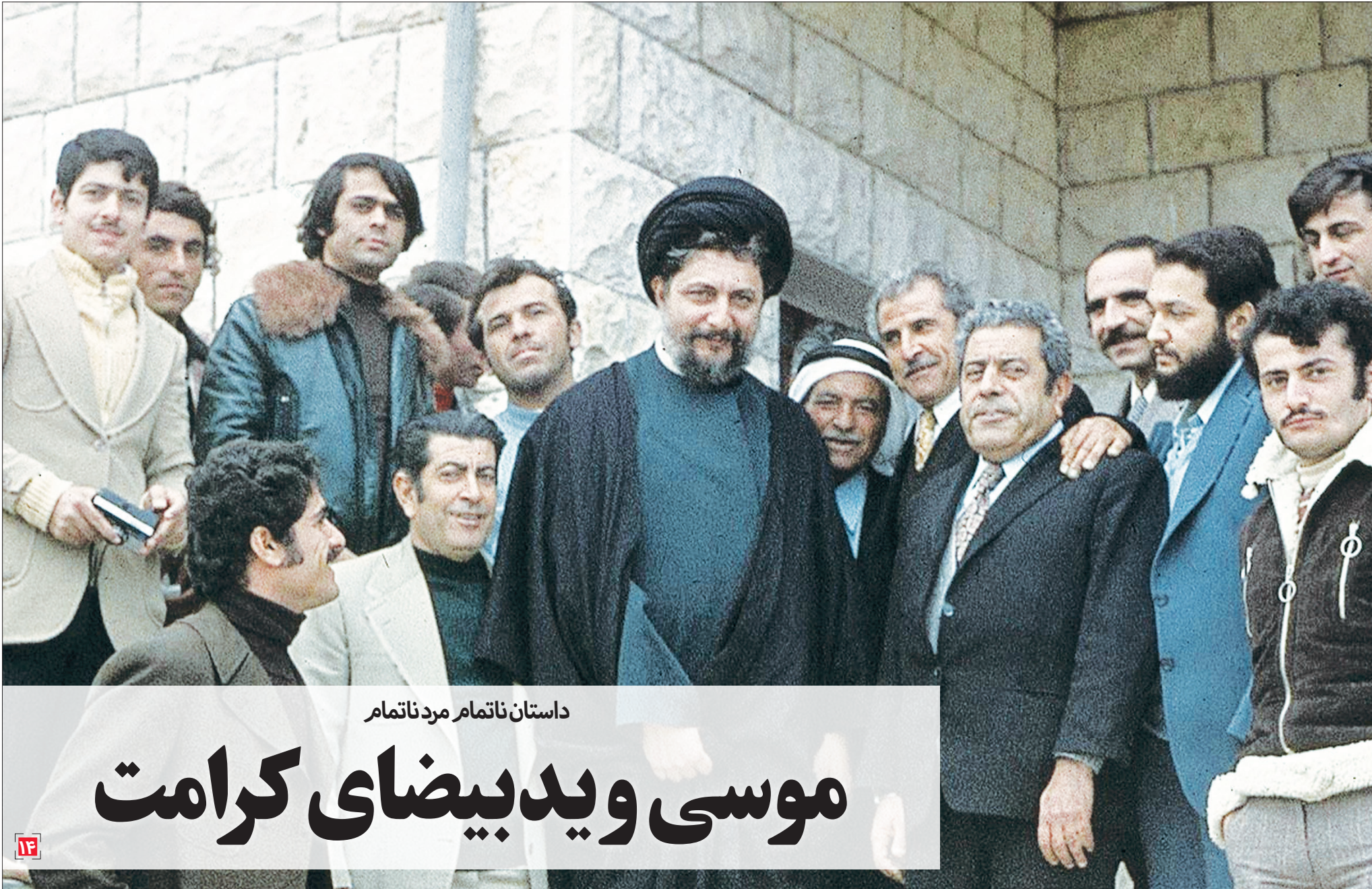
داستان ناتمام مرد ناتمام