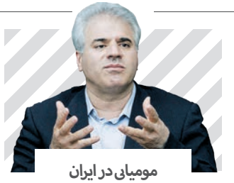
مومیانی در ایران نداریم!