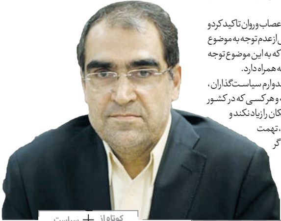
کوتاه از + سیاست

کرده است. هاشمی ادامه داد: یکی سردار قلم می‌شود و هر چه دلش می‌خواهد می‌نویسد، اهانت می‌کند و دروغ می‌گوید، یکی سردار علم می‌شود و در نوحه خوانی از رئیس‌جمهوری گرفته تا بقیه همه را زیر سوال می‌برد. یکی در تریبون نماز جمعه در همه حوزه‌ها اظهار نظری کند و رای می‌دهد و یکی در حوزه غذا در مورد مواد غذایی تزارخه مردم را می‌ترساند و می‌گوید صهیونیست‌ها و آمریکایی‌ها آمده اند و می‌خواهند نسلتان را تغییر دهند. وی افزود: افرادی هم نیز بدون اطلاع در مورد تزارخه‌ها صحبت می‌کنند و این مساله آراش مردم را تحت تأثیر قرار می‌دهد البته این مسائل شایعاتی بوده که عمدتاً به غرض آمده است. وزیر بهداشت گفت: برای کاهش اختلالات روان پزشکی در وزارت بهداشت کارهایی انجام شده. ولی کافی نیست. بیماران اعصاب و روان منظم‌ترین بیماران هستند و جمعیتی