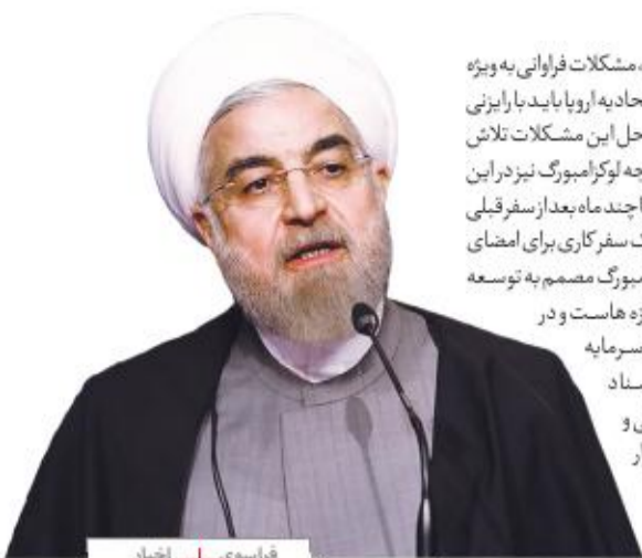
فرا سوی + اخبار

افراطی گری فراروی همه ماست و حل آنها تنها با یک اراده قوی تر و همکاری بیشتر میسر است و رابرتی و همکاری ایران و اتحادیه اروپا می تواند بسیاری از این مشکلات را کاهش دهد. رئیس شورای عالی امنیت ملی با تاکید بر اینکه جمهوری اسلامی ایران به هیچ عنوان ناقض هر موافقت نامه ای که آن را امضا کرده باشد، نبوده و تازماتی که طرف های مقابل به تعهداتشان پایبند باشند، پای تعهدات و امضای خود خواهد ایستاد، گفت: برجام توافقی است که با رویکرد برد- برد تدوین و امضا شد و امروز همگان باید برای تداوم این توافق تلاش کنند، چرا که هر حرکتی در راستای تضعیف آن می تواند همه کشورها را در روند حل مسائل منطقه ای و جهانی، نسبت به کارایی مذاکره و توافق، بدبین و ناامید کند. روحانی یادآور شد: در منطقه از جمله