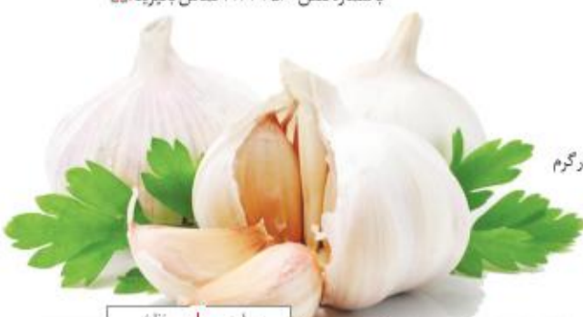
بیماری + زنان

موجب کم‌خونی شدید می‌شود. برای اطلاعات بیشتر می‌توانید به بازار گیاهان دارویی مراجعه کرده و ضمن استفاده از کلاس‌های آموزشی و همایش‌های رایگان آن، با شماره تلفن ۰۲۱۴۴۳۵۶۰ تماس بگیرید.