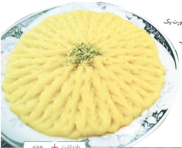
یادداشت + هفته

دراه به قدیسی برخوردند که در لایه ای انبوهی از استخوان دنبال چیزی می‌گشت. پادشاه از او پرسید: چه کاری کنی؟ قدیس پاسخ داد: افتخار بر اعلی حضرت. وقتی فهمیدم که پادشاه اسپانیا در راه هستند، تصمیم گرفتم دنبال استخوان‌های پدرانم بگردم تا آنها را به شما تقدیم کنم، اما هر چه می‌گردم، نمی‌توانم پیدا کنم، چون هیچ فرقی با استخوان‌های کشاورزان، بینوایان و گدایان و ببردگان ندارند.