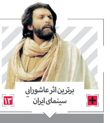
بزرگترین اثر عاشورایی سینمای ایران