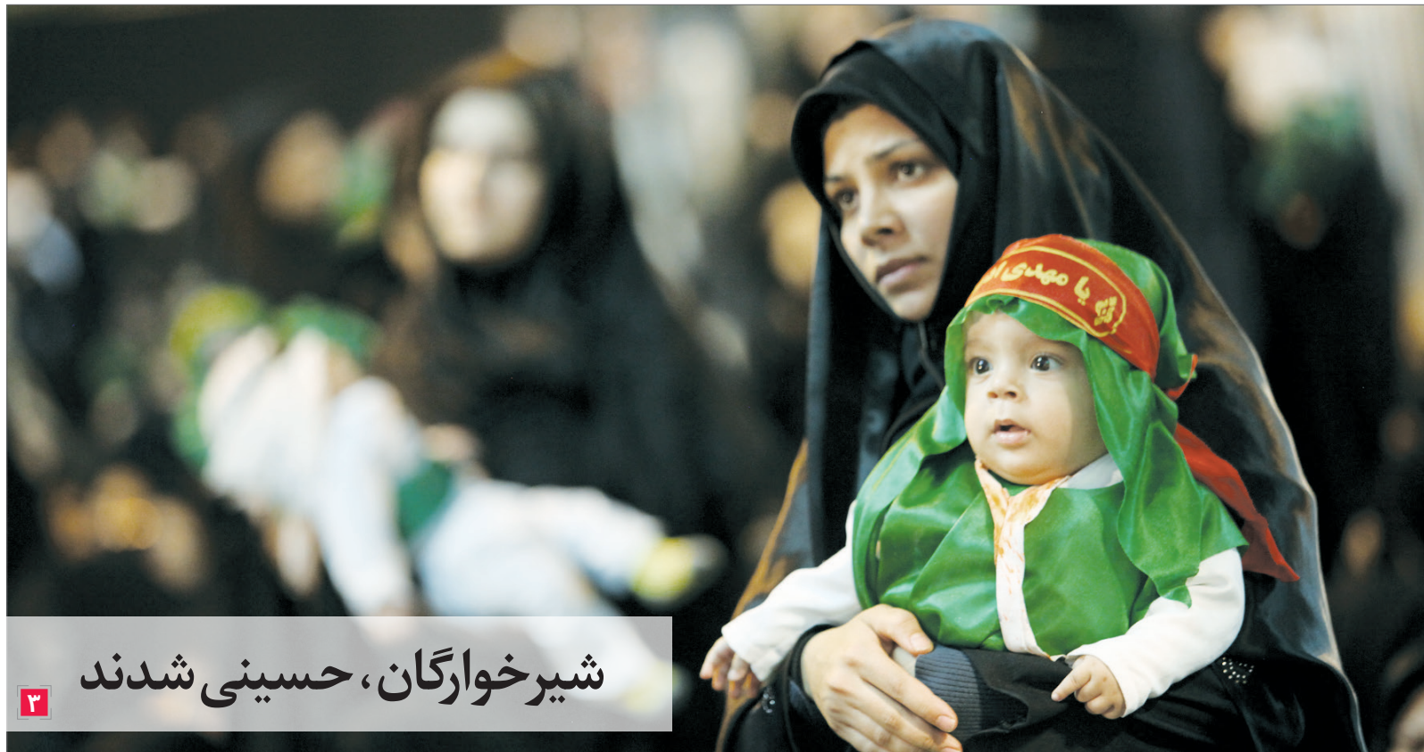
شیرخوارگان، حسینی شدند