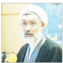
وزیر دادگستری با اشاره به اینکه روند رشد درآمدهای مالیاتی در طی سال‌های اخیر، روند مطلوبی بوده، اظهار داشت: سازمان امور مالیاتی کشور عملکرد خوبی در اجرای سیاست‌های اقتصاد مقاومتی داشته به طوری که در حال حاضر سهم درآمدهای مالیاتی از بودجه جاری نسبت به سهم نفت، فاصله نسبتاً زیادی گرفته است.

به گزارش رسانه مالیاتی ایران، حجت‌الاسلام مصطفی پورمحمدی با ذکر این مطلب که در تمام دنیا، بزرگ‌ترین تشکیلات اداری و دقیق‌ترین قوانین در نظام‌های مالیاتی ایجاد شده، گفت: به ویژه در کشورهای توسعه یافته، فرار مالیاتی یکی منکر بزرگ و بدون بخشش محسوب می‌شود