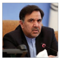
وزیر راه و شهرسازی با بیان اینکه اروپا را از طریق کریدور شماره ۱۰ به خلیج فارس متصل می‌کنیم

گفت: این کریدور از بازگان تا بندر امام خمینی و دریای خلیج فارس امتداد دارد و مسیری است که می‌تواند در سطح منطقه‌ای و بین‌المللی اهمیت داشته باشد. آخوندی افزود: کریدور شماره ۱۰ از نظر بین‌المللی دارای ارزش است که این مسیر کوتاه‌ترین کریدور اتصال اروپا به خلیج فارس با هزار و ۴۵۰ کیلومتر است و با این شبکه بزرگراهی که ظرفیت ارتقا به ازاداره را دارد می‌توان اروپا را با کوتاه‌ترین مسیری به آب‌های خلیج فارس متصل کرد. وی ادامه داد: همچنین این کریدور از این جهت دارای ارزش منطقه‌ای است که