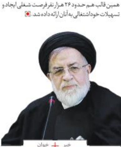
خبر + خوان