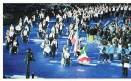
۲۰۱۲ پارالمپیک لندن

درخشش ایران در پارالمپیک لندن، کاروان ورزشی کشورمان در هفتمین حضور در رقابت‌های پارالمپیک با ۷۹ ورزشکار در ۱۰ رشته والیبال نشسته، گلابال، جودو، دو و میدانی، فوتبال (ناپنیان)، وزنه برداری، تیراندازی، تیر و کمان، بسکتبال با ویلچر و تنیس روی میز حضور یافت و موفق به کسب ۲۴ مدال شامل ۱۰ طلا و ۷ نقره، ۷ برنز شد و در جایگاه یازدهم قرار گرفت و درخشان‌ترین حضور را در لندن رقم زد.