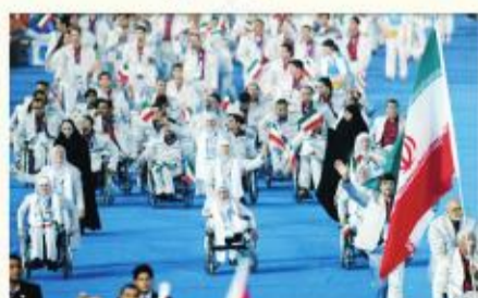
۲۰۰۸ پارالمپیک پکن

چهار سال بعد کاروان ورزشی کشورمان با ۷۴ ورزشکار در ۹ رشته ورزشی بسکتبال با ویلچر، والیبال نشسته، گلابال، جودو، فوتبال (ناپنیان)، دو و میدانی، وزنه برداری، تیراندازی و تنیس روی میز به این رقابت‌ها اعزام شد و با کسب ۱۴ مدال شامل ۵ طلا، ۶ نقره و ۳ برنز شد و با یک پله صعود در جایگاه بیست و دوم جدول مدال‌آوران قرار گرفت.