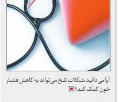
آی می داندید شکلات تلخ می تواند به کاهش فشار خون کمک کند؟