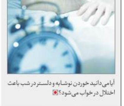
آی می داندید شکلات و شیرینی برای پوست بدنمان مضر است؟ اختلال در خواب می شود؟