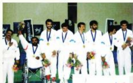
۱۹۹۶ پارالمپیک آتلانتا

در سال ۱۹۹۶ در پارالمپیک آتلانتا، کاروان ورزشی ایران و با ۳۰ ورزشکار در چهار رشته والیبال نشسته، وزنه برداری، تیراندازی و دو میدانی شرکت کرد و موفق به دریافت ۱۷ مدال شامل ۹ طلا، ۵ نقره و ۳ برنز و با صعود در جدول رده‌بندی مدال‌ها در جایگاه بیستم ایستاد.