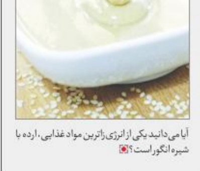
آی می داندید یکی از بهترین زاترین مواد غذایی، ارده با شیره انگور است؟