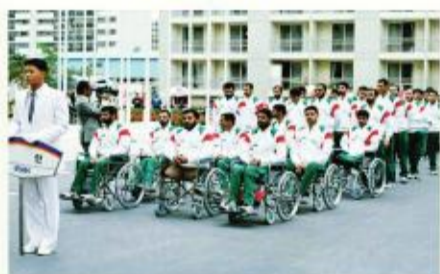
۱۹۸۸ پارالمپیک سنول

نخستین تجربه در سنول، کاروان پارالمپیک ایران در سال ۱۹۸۸ برای نخستین بار در رقابت‌های پارالمپیک سنول با ۳۶ ورزشکار در ۴ رشته ورزشی والیبال نشسته و دو میدانی، وزنه برداری و گلابال حضور پیدا کرد و در پایان با کسب ۸ مدال شامل ۴ طلا، ۲ نقره و ۲ برنز در جایگاه بیست و هشتم جهان قرار گرفت.