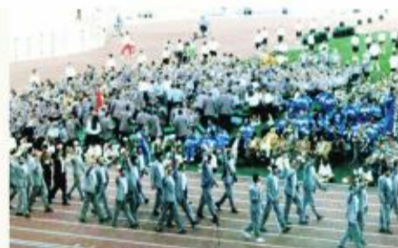
۱۹۹۲ پارالمپیک بارسلون

چهار سال بعد در سال ۱۹۹۲ کاروان ورزشی کشورمان به پارالمپیک بارسلون اعزام شد و با ۲۹ ورزشکار در سه رشته ورزشی والیبال نشسته، تنیس روی میز و گلابال شرکت نمود و موفق به کسب ۴ مدال شامل یک طلا، ۲ نقره و یک برنز و با نه پله سقوط در جایگاه سی و هفتم قرار گرفت.