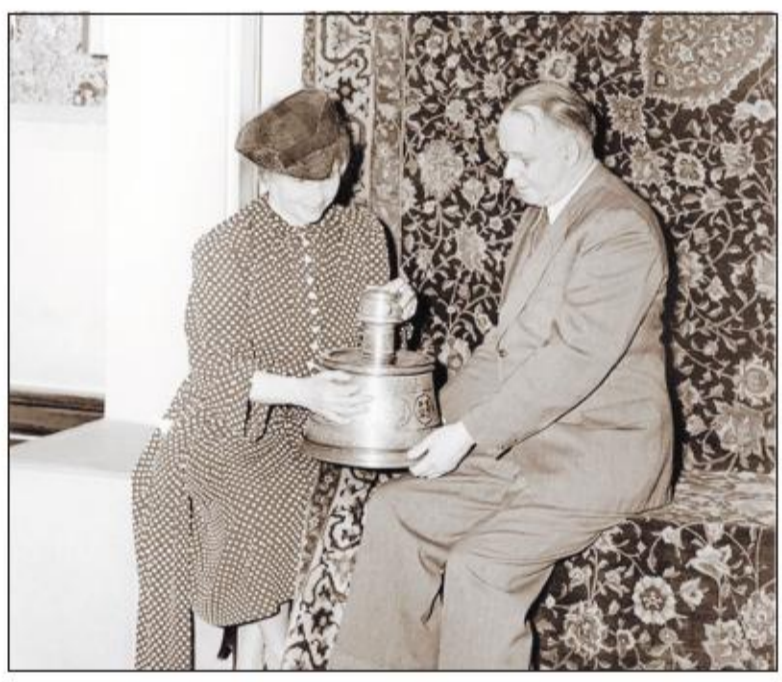
پوپ، کلر و طرف ایرانی - تصویر، آرتور پوپ ایرانشناس مشهور آمریکایی را در جریان نمایشگاهی که در سال ۱۹۴۰ میلادی به همت وی با عنوان شش هزار سال هنر ایرانی در نیویورک برگزار شد، نشان می‌دهد، وی یک

طرف عتیقه ایرانی را جلوی هنر کلر، نویسنده ناپیای آمریکایی گرفته تا او را رالمس کند؛ گفتنی است؛ رتور پوپ در سوم سپتامبر ۱۹۶۹ در شیراز درگذشت و در نزدیکی بی‌خواجه به خاک سپرده شد.