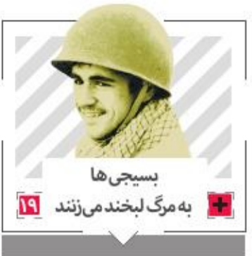
بسیجی ها به مرگ لبخند می زنند