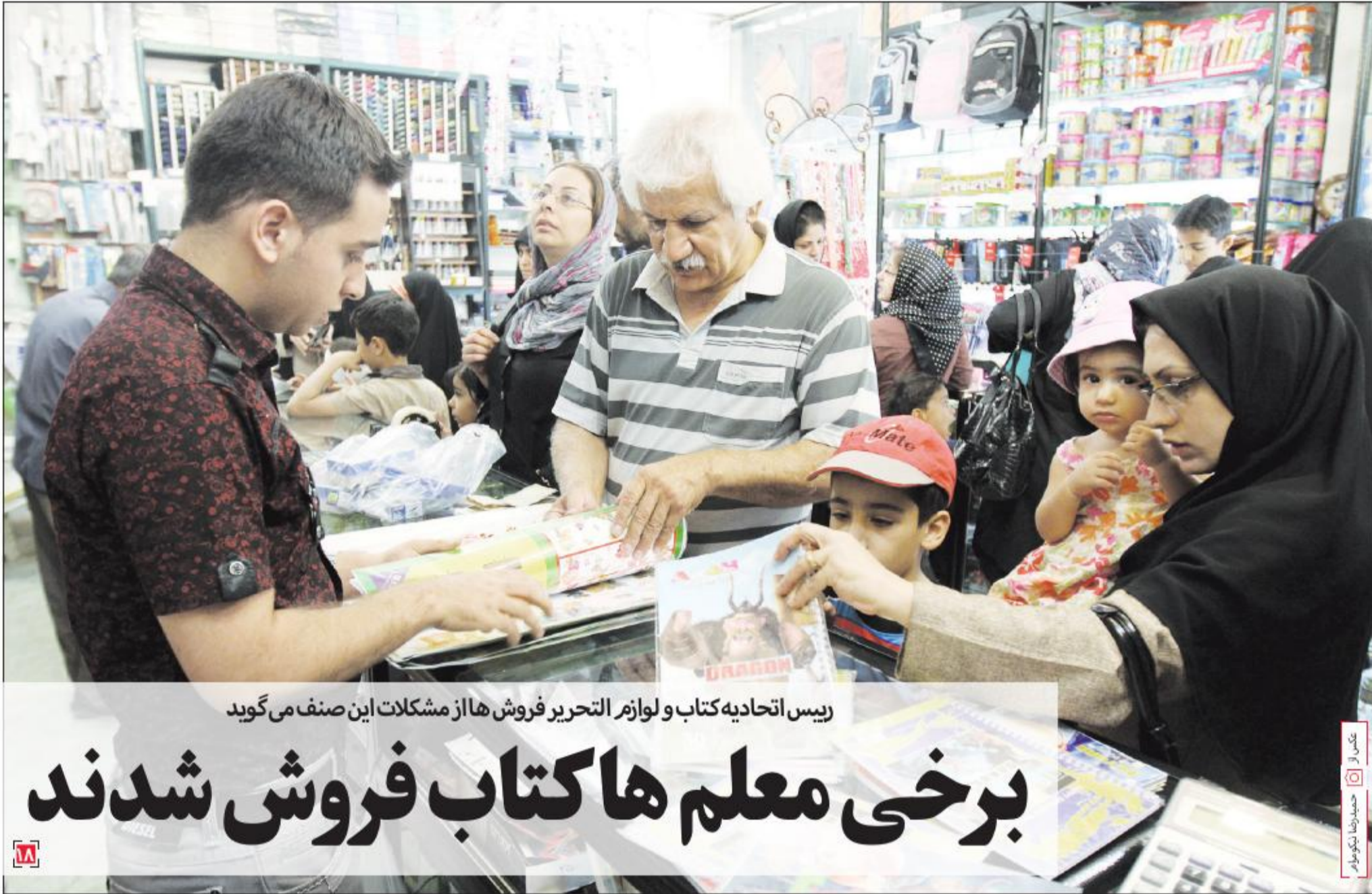
ریس اتحادیه کتاب و لوازم التحریر فروش ها از مشکلات این صنف می گوید