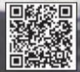
بانکد را اسکن کنید