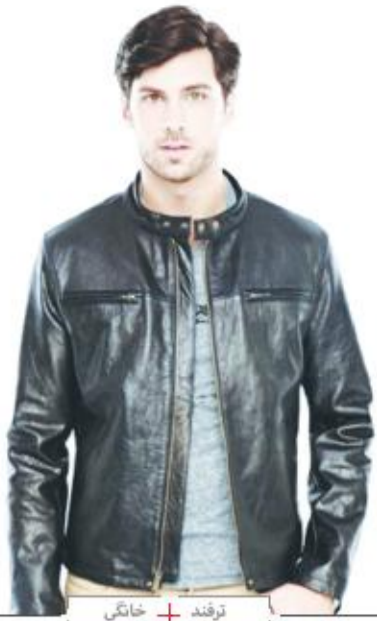
ترند + خانگی

مورد استفاده قرار دهد. متلاک کت قدیمی خوش دوخت با یک دامن جدید می تواند جور شود و یک دست لباس شیک بسازد و یا یک بلوز قدیمی با یک کمربند، شکل تازه ای به خود می بخرد. مرتب کردن کمد لباس: لباس ها را طوری در کمد قرار دهید که لباس های بر مصرف در دسترس باشند. کف کمد را می توانید به کش ها و پوئین ها اختصاص دهید. آنها را تمیز و مرتب بچینید. بهتر است چکمه ها و بوتین ها را روی یک میله چوبی و زونه قرار دهید تا خشک نشوند. برای جوارب ها و جوراب سلواری های می توانید از یک کیسه یا جاجواری استفاده کنید و آن را به داخل در کمد بیاورید. درست است که کمد لباس در معرض دید نیست، اما این دلیل نمی شود که نامرتب باشد. کمد لباس را با بوگیرهای خوشبوایی که به همین منظور به فروش می رسد خوشبو کنید و هرگز لباسی