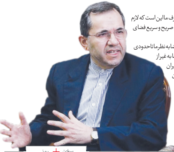
سخن + روز

وجود دارد که اکنون مصوبات آن را تصویب کرده‌ایم، بنابراین علاوه بر مشکلات اجرا که آمریکا ایجاد می‌کند، برخی مشکلات هم به مشکلات غیربرجامی برمی‌گردد. این دیپلمات ارشد کشورمان در پاسخ به این پرسش که به نظر می‌آید اجرای موفقیت‌آمیز برجام امری قابل تفسیر در توافق است و هر یک از طرف‌ها از آن برداشت متفاوت دارند، گفت: در جلسات به طور جدی و علنی گفته‌ایم که ما باید میوه اجرای برجام را بنوائیم بچینیم که آن هم رفع تحریم‌هاست. اگر نتوانیم این میوه را بچینیم توافق موفقیت‌آمیز اجرا نشده است. این خیلی روشن است و وقتی این مساله را در جلسات و ملاقات‌ها مطرح می‌کنیم آنها این را به چالش نمی‌کشند و نمی‌گویند شما (ایران) اشتباه می‌کنید. فقط می‌گویند که ما داریم روی این مساله کار می‌کنیم، اما این کار زمان می‌برد و