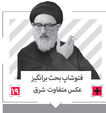
فتوشاپ بحث برانگیز عکس متفاوت شرق