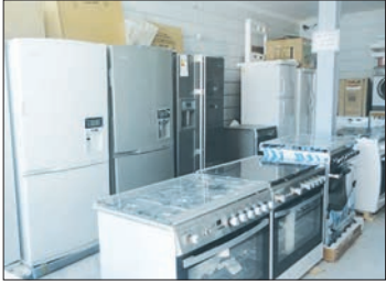
شهن اشعانی اصلاتی

که در آن نام برده شده خرید کنید در فرعه‌کشی ماهیانه شرکت می کنید.