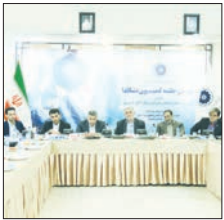
معاون تشکل های اتاق بازرگانی ایران

توسعه یافته در بخش فعالیت های تشکلی است. معاون تشکل های اتاق ایران تاکید کرد: تشکل ها در فضای کسب و کار امروز باید فعالانه وارد عرصه اقتصادی شوند و مأموریت ملی آنان این است در راستای اصلاح سیاست های نادرست اقتصادی گام بردارند. وی در بخش دیگری از سخنان خود به فعالیت