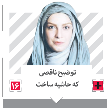
توضیح ناقصی که حاشیه ساخت