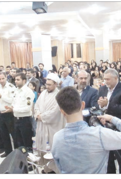
خاطرات آزادگان مسوول هستند، خاطرنشان کرد: در این زمینه آزادگان را باید به عنوان گروه های مرجع به جامعه معرفی کنیم و بارچ نهادن به آن ها، جوانان به سوی آزادگان جذب خواهند شد و همانطور که امام

وی با بیان اینکه آزادگان نماد مقاومت ملت ایران و بخشی از تاریخ مقاومت انقلاب اسلامی هستند، افزود: این عزیزان ولی نعمت های ما در جامعه هستند و به آن ها احساس بین داریم، چرا که افزون بر شرکت در جهاد، سال هایی را به دور از وطن و در سخت ترین شرایط گذراندند. شهردار مبارکه اظهار کرد: بازگشت آزادگان به کشور از چند جهت حائز اهمیت است: از جمله اینکه برگشت پیروزمندان این عزیزان دلیلی بر شکست توطئه های استکبار در به چالش کشاندن جمهوری اسلامی و انقلاب اسلامی است. وی با اشاره به ضرورت انتقال مصادب و سختی های آزادگان به جوانان و آگاهی از جانفشانی های آزادگان در یاسداری از انقلاب اسلامی، گفت: اخلاقی و مناعت طبع آزادگان و جهاد برای رضای خدا در برخی موارد سبب شده تا این عزیزان به دشواری خاطرات خود را مطرح کنند و این بزرگواران خاطرات را به صورت گفتاری و نوشتاری برای جوانان تبیین کنند، چرا که این خاطرات بخشی از اسناد انقلاب اسلامی محسوب می شود. شرفا با بیان اینکه مسوولان نیز در زمینه نشر