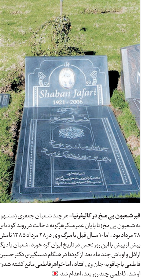
قبر شعبون بی مخ در کالیفرنیا - هر چند شعبان جعفری (مشهور به شعبون بی مخ) تا پایان عمر مکرر گونه دخالت در روند کودتای ۲۸ مرداد بود. اما ۱۰ سال قبل با مرگ وی در ۲۸ مرداد ۱۳۸۵ نامش بیش از پیش با این روز نخس در تاریخ ایران گره خورد. شعبان با دیگر ارادل و اوپاش چند ماه بعد از کودتا در هنگام دستگیری دکتر حسین فاطمی با جا قوف به جان وی افتاد. اما خواهر فاطمی مانع کشته شدن او شد. فاطمی چند روز بعد، اعدام شد.

کلیشه ای، اما مهم و غیر قابل کتمان، هم برای سفارش دهنده و هم برای سفارش گیرنده، نمونه قابل مطرح آن در تاریخ سینما «ده فرمان» است که در ۱۰ ایزورد توسط کیلوفسکی ساخته شد و در واقع یک سفارش با موضوعات ۱۰ فرمان موسی (ع) بود. اخیراً جشنواره فیلم کوتاه رضوی در یازدهمین دوره خود در قسمت داستانی به سه فیلم «قمارباز»، «چله» و «باد هر وقت که بخوادمی زد» جوایز اول تا سوم خود را اهدا کرد. اما به دلیل تماشای این فیلم ها از انتخاب این فیلم ها در این جشنواره!! به شدت متعجب و متحیر شدم. سری به فراخوان جشنواره زد م و موضوعات آن را مجدداً مطالعه کردم. اهداف، اشاعه و ترویج فرهنگ منور رضوی و... موضوعات: ۱- فرهنگ رضوی ۲- سبک زندگی اسلامی (لطفاً برای توضیح مفصل تر به فراخوان اصلی مراجعه کنید).