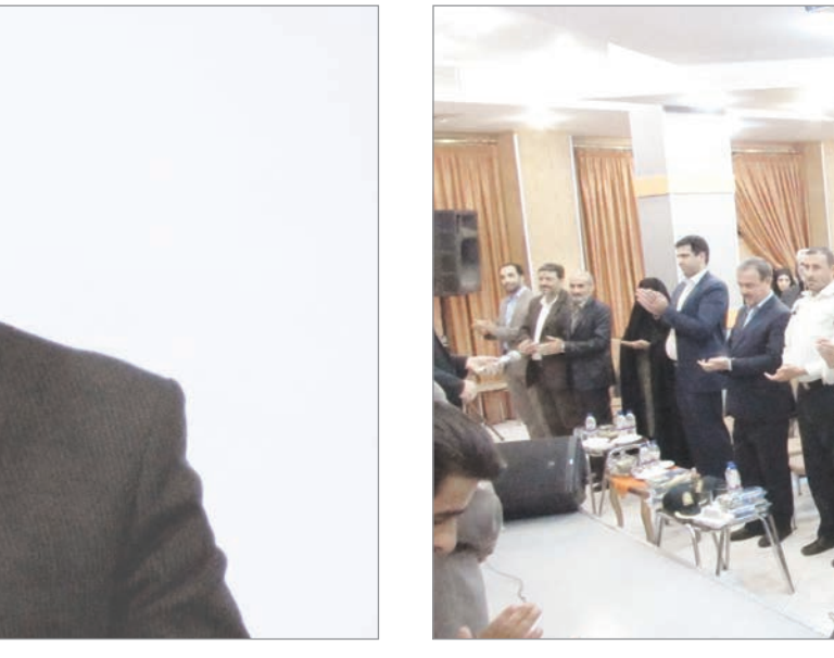
خاطرات آزادگان مسوول هستند، خاطرنشان کرد: در این زمینه آزادگان را باید به عنوان گروه های مرجع به جامعه معرفی کنیم و بارچ نهادن به آن ها، جوانان به سوی آزادگان جذب خواهند شد و همانطور که امام

آن را مدیون آن همه ایثار رزمندگان دوران دفاع مقدس هستیم. شرفا با اشاره به اینکه در همه جای زمانی که رزمندگی تمام و اسارت آغاز می شود، رزمندگان اسیر مادوره دیگری از مبارزه را آغاز کردند، در سیاه چال ها و شکنجه گاه های دشمن از ارزش ها و دین خود دفاع کردند.