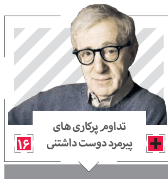
تداوم پرکاری های پیرمرد دوست داشتنی