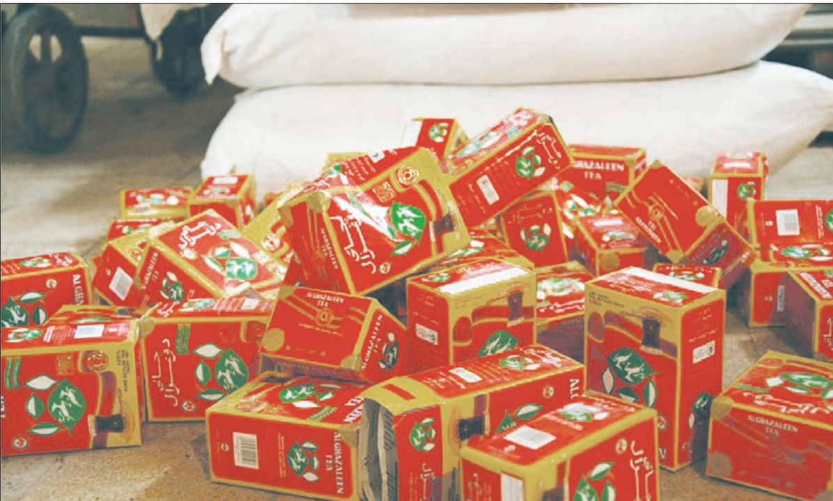
چای قاچاق در بازار تهران

سابقه مصرف چای در ایران به سال های بسیار دور بازمی گردد ، اما طبق شواهد تاریخی تا زمان صفویه چای اغلب به صورت دارو برای درمان برخی بیماری ها مورد استفاده قرار می گرفت و در این دوران کم کر پای چای به مجالس مهم و تشریفاتی باز شد و پس از ورود به خانه های اعیان و اشراف ، به تدریج به عنوان پرطرفدارترین نوشیدنی به تمام خانه های ایرانی راه یافت. رواج مصرف چای تا آنجا رسید که امروزه تقریباً هر ایرانی در طول یک شبانه روز حداقل یک فنجان چای مصرف می کند و چای جزء اصلی سبد خرید ماهیانه هرخانوار است.