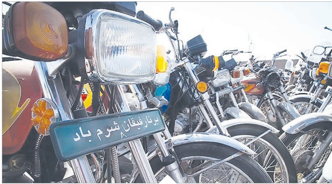
عکس از: برگزاری مسابقه

۶۰ هزار موتورسیکلت در پارکینگ های استان توقیف شده اند