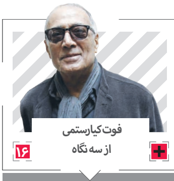
فوت کیارستمی از سه نگاه