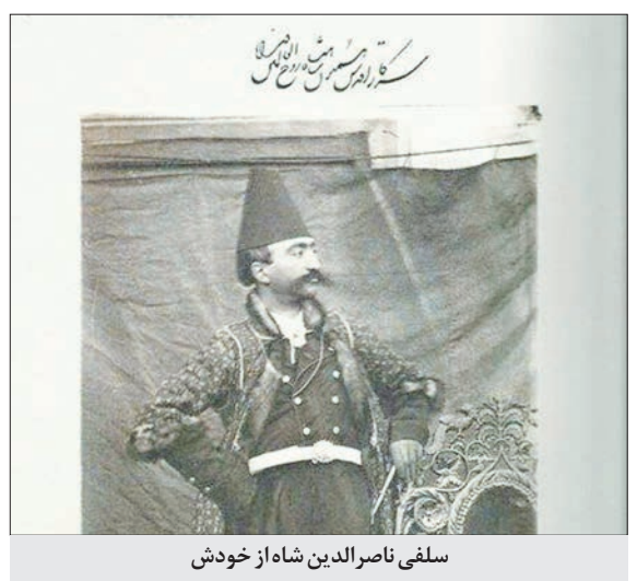
سلفی ناصرالدین شاه از خودش