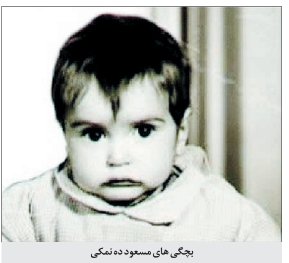
بچی های مسعود ده نمکی