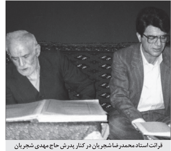
قرانت استاد محمدرضا شجریان در کنار پدرش حاج مهدی شجریان