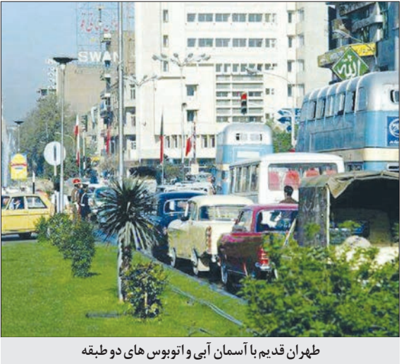
تهران قدیم با آسمان آبی و اتوبوس های دو طبقه