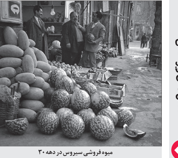
میوه فروشی سیروس در دهه ۳۰