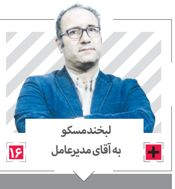
به آقای مدیرعامل لیکندمسکو