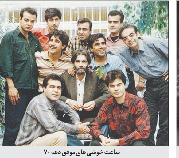
ساعت خوشی های موفق دهه ۷۰