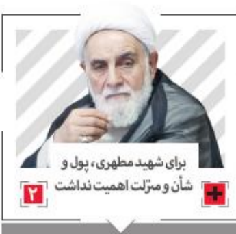
برای شهید مطهری، پول و شأن و منزلت اهمیت نداشت