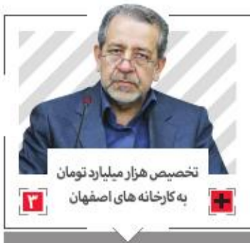
تخصیص هزار میلیارد تومان به کارخانه های اصفهان

پنتر مازکوس تحلیل گر برجسته فولاد جهان: شرکت فولاد مبارکه اصفهان ستاره نوظهور فولاد جهان