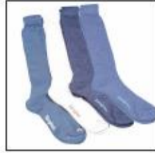
باقی مانده است.

جوراب های نخي در قرن نوزدهم جوراب های نخي ساخته شده با ماشين در دسترس خانم ها قرار گرفت. بعد از جنگ جهانی اول (۱۹۱۴-)