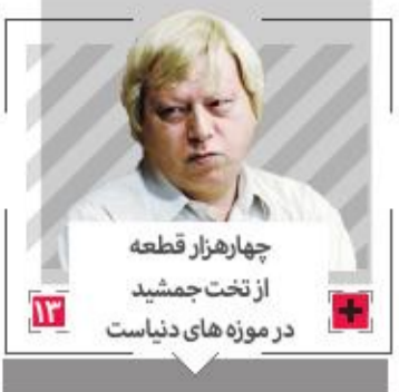
چهارهزار قطعه از تخت جمشید در موزه های دنیاست