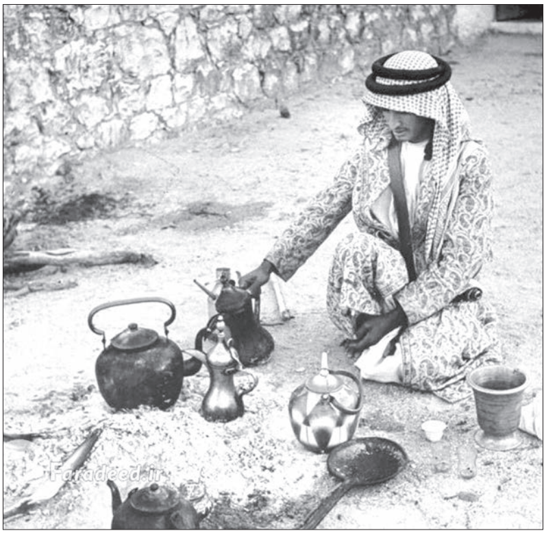
عربستان قبل از نفت - تصویر، فروشنده قهوه مخصوص عربی را در خیابان های جده حدود ۷۵ سال قبل نشان می دهد. آن روزها مردمی که در عربستان زندگی می کردند اغلب بادیه نشین بودند و شهرنشینی به مناطق حاصل خیز

نقطه ای که این روزها پاچای پای خیابان های بزرگ دنیا می گذارد و علاقه مردم ایران زمین به احترام به قوانین رانندگی، محیط زیست و پیاده مداری را به نمایش می گذارد.