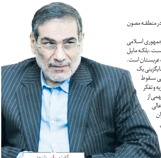
گفت + شنود

سوریه برخوردار است و از نگاه مردم این کشور با وجود فشارهای سیاسی، امنیتی و اقتصادی، او توانسته در بحران اخیر ایستادگی کند. وی در پاسخ به سوالی در مورد آینده سوریه گفت: نحوه شکل گیری روند های سیاسی و تفاهم طیف های مختلف داخلی، آینده سوریه را تعیین خواهد کرد. همه طرف ها به طور همزمان باید به مهار جریان تروریسم، قطع کمک های خارجی به آنها و گفت و گوهای ملی بیندیشند. ما این روند را بهترین شیوه برای پایان دادن به بحران این کشور از نایبی می کنیم و طی سال های گذشته نیز همین روند را تعقیب کرده ایم. دبیر شورای عالی امنیت ملی با اشاره به وجود طرح هایی از سوی کشورهای غربی برای تجزیه منطقه یاد آور شد؛ کشورهایی مانند ترکیه و عربستان سعودی باید تکلیف خودشان را روشن کنند. آیا از روند تجزیه در سوریه و کشورهای اسلامی استقبال می کنند؟ آیا