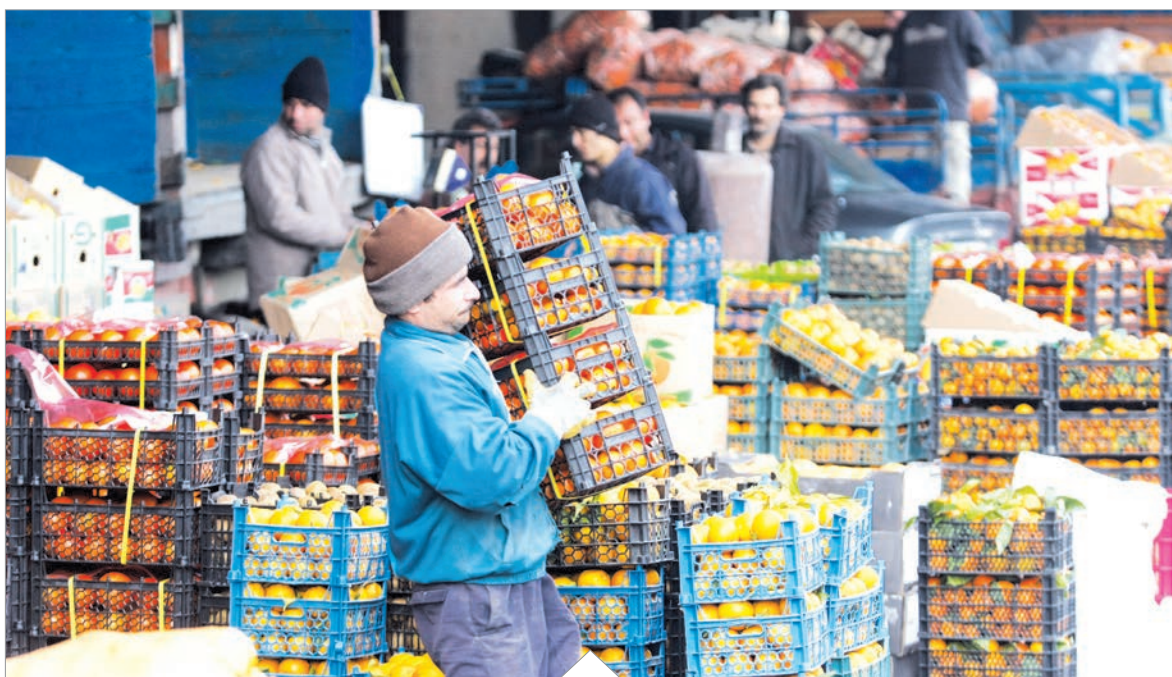
بازار میوه تشنه نظارت و کارشناسی