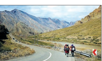
بعد از مدتی سفر کردن با ماشین شخصی و یا اتوبوس همراه دوستان و گشت و گذار در خیابان‌های شهر...

یک سفر بهاری متفاوت را تجربه کنید سفر از اصفهان به تبریز به روش «هیچ‌هایکی»