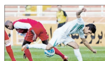
رقابت‌های لیگ برتر امروز با برگزاری دو دیدار مهم میان تیم‌های استقلال و سپاهان، ذوب آهن و تراکتور پیگیری می‌شود...

در ادامه رقابت‌های هفته بیست و پنجم رخ می‌دهد: سپاهان در فکرا انتقام ذوب آهن در اندیشه صدر