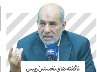
ناگفته‌های نخستین رئیس انرژی اتمی درباره برجام