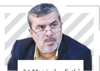
تولد یک میلیون و ۵۸۰ هزار نوزاد در سال ۹۴

تحلیل بر ترکیب فراکسیون‌های سیاسی در مجلس آینده مجلس دهم چند ضلعی می‌شود؟