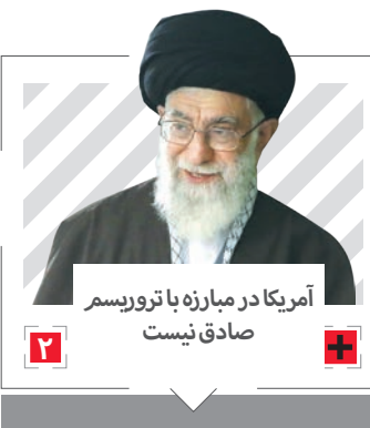
آمریکا در مبارزه با تروریسم صادق نیست