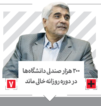
۳۰۰ هزار صندلی دانشگاه‌ها در دوره روزانه خالی ماند