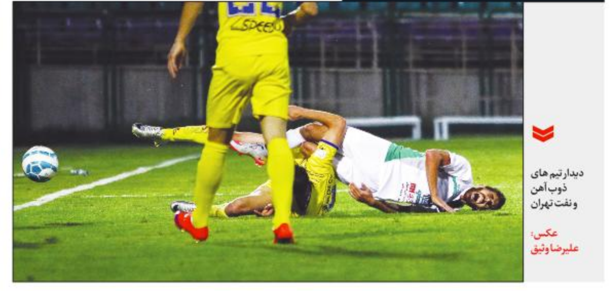
دبدار تیم های ذوب آهن ونفت تهران