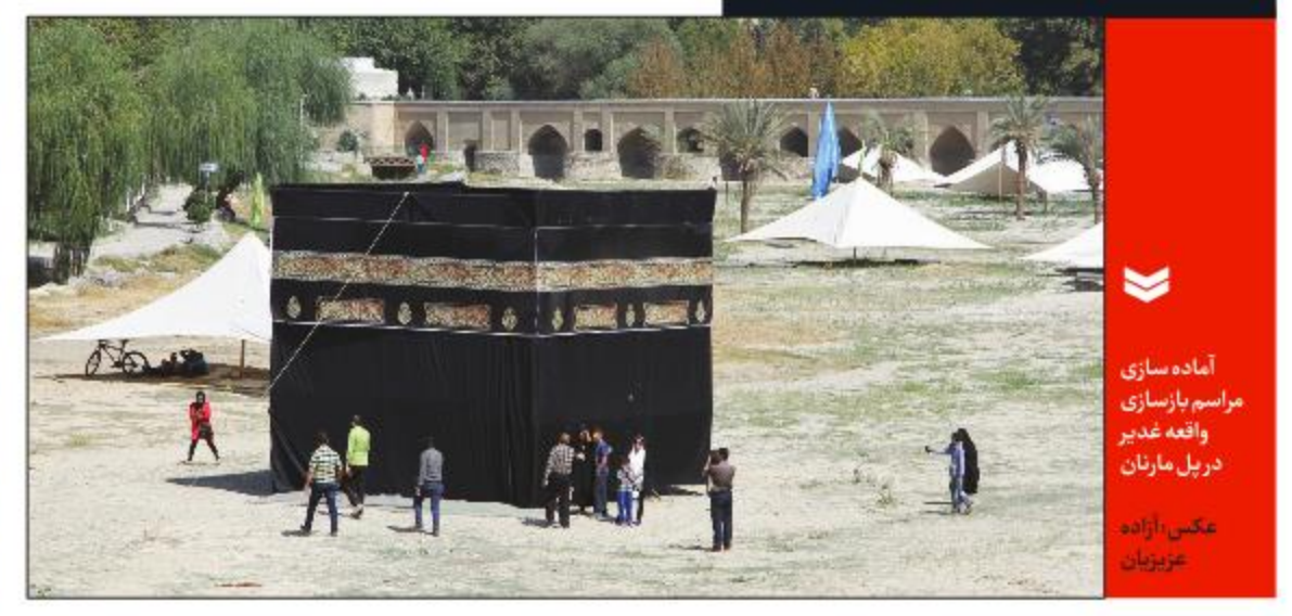
آماده سازی مراسم بازسازی واقعه غدیر در پل مارشان