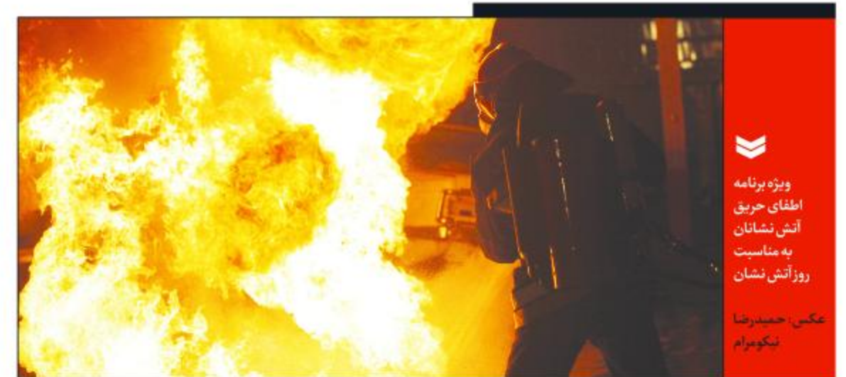
ویژه برنامه اطفای حریق آتش نشانیان به مناسبت روز آتش نشان