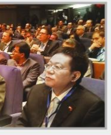
وزیر راه و شهرسازی در این همایش شرکت کرد.