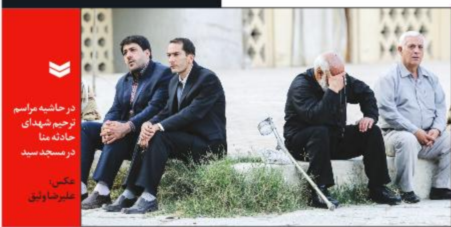
در حاشیه مراسم ترجمه شهدای حادثه منا در مسجد سید