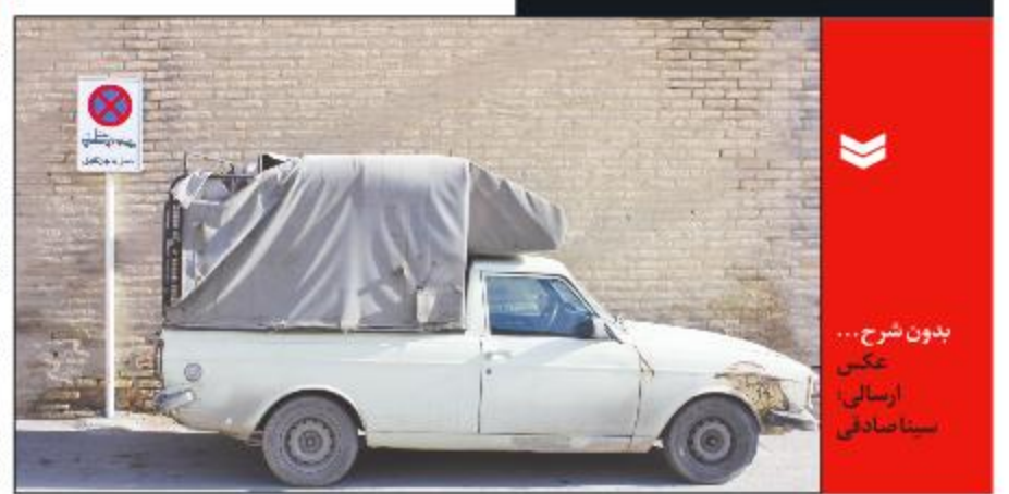
بدون شرح...