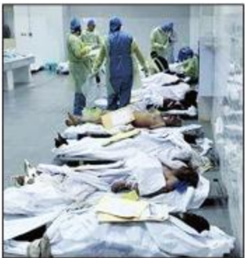
DNA برای احراز هویت قربانیان استفاده می کنیم.