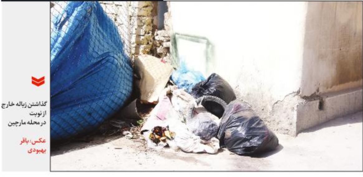
گذاشتن زباله خارج از نوبت در محله مارچین