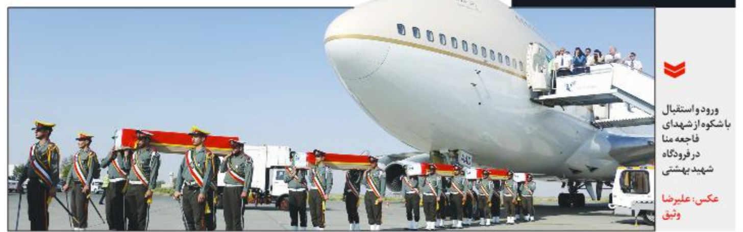
ورود و استقبال باشکوه از شهدای فاجعه منا در فرودگاه شهید بهشتی