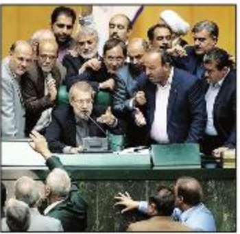
این نماینده مجلس گفت: قرار نبود در باره برجام در مجلس رای گیری صورت گیرد، اما اکنون که قرار است در این باره رای گیری شود، باید وجود دارد که نباید از افساس گذرد...