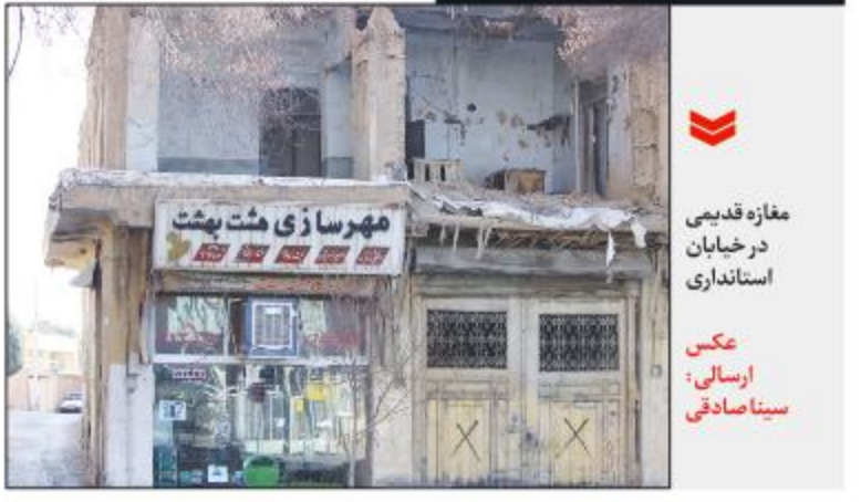
مغازه قدیمی در خیابان استانداری