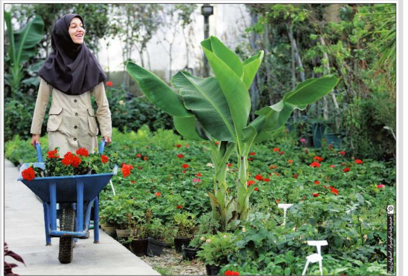
افتتاح بیستمین جشنواره گل و گیاه در اصفهان؛