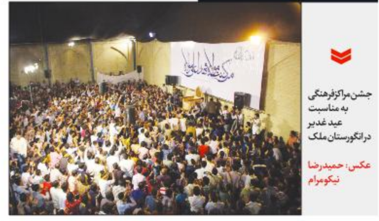
جشن مراکز فرهنگی به مناسبت عید غدیر در انگورستان ملک