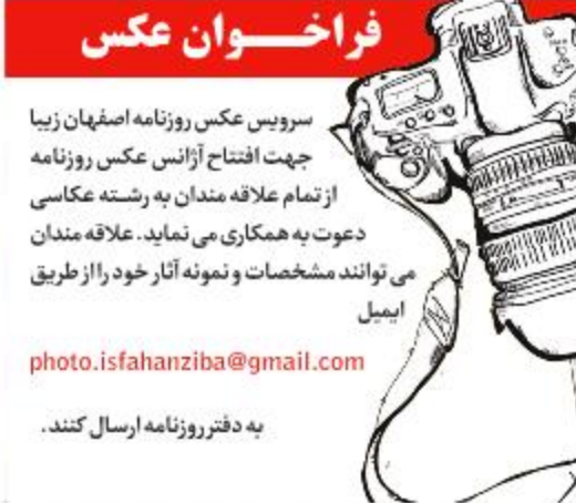
فراخوان عکس سرویس عکس روزنامه اصفهان زیبا جهت افتتاح آژانس عکس روزنامه از تمام علاقه مندان به رشته عکاسی دعوت به همکاری می نماید. علاقه مندان می توانند مشخصات و نمونه آثار خود را از طریق ایمیل photo.isfahanziba@gmail.com به دفتر روزنامه ارسال کنند.