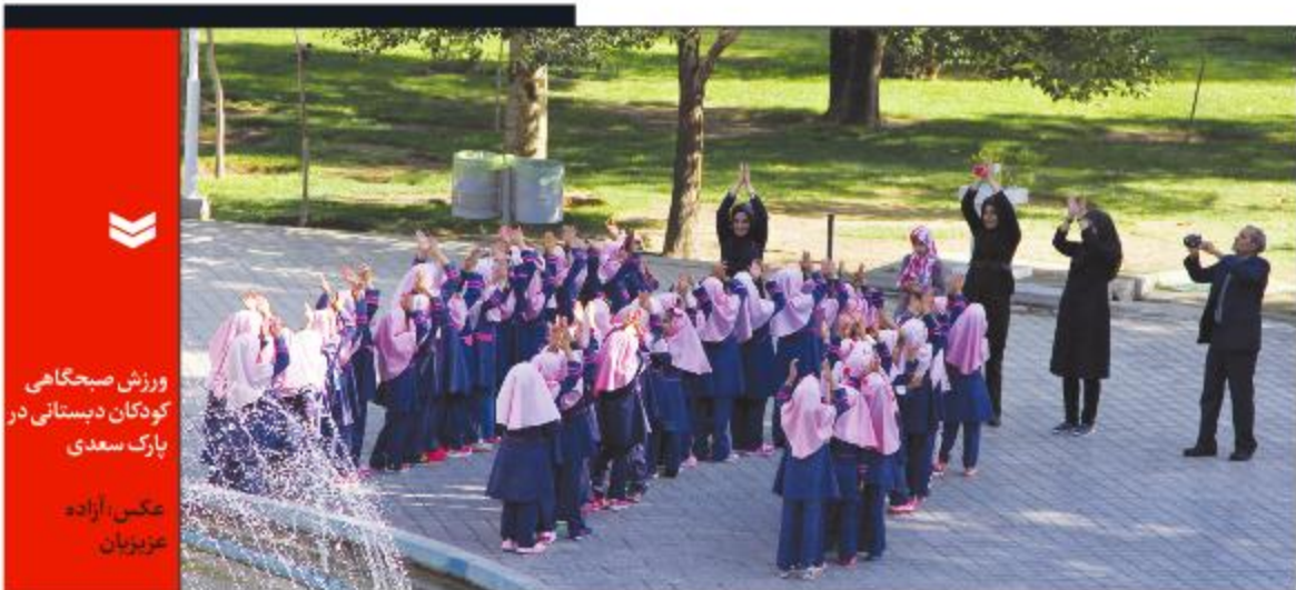
ورزش صبحگاهی کودکان دبستانی در پارک سعدی