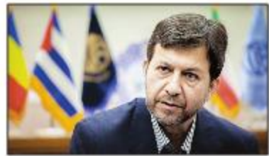
شهردار اصفهان گفت: در سفر اخیر رییس جمهور آتریش به ایران بحث خواهرخواندگی اصفهان با وین مطرح شد و وزیر امور خارجه نیز در جریان این