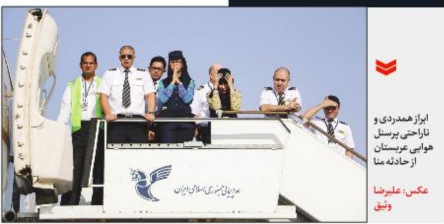
ایراز همدردی و ناراحتی پرسنل هوایی عربستان از حادثه منا