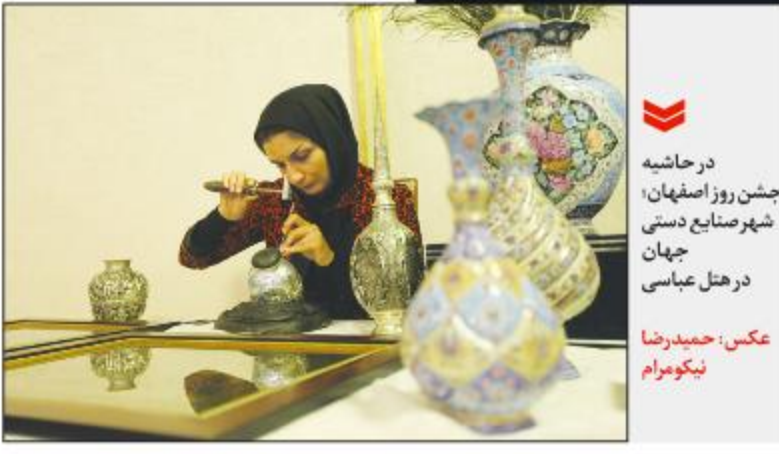
در حاشیه جشن روز اصفهان، شهر صنایع دستی جهان در هتل عباسی