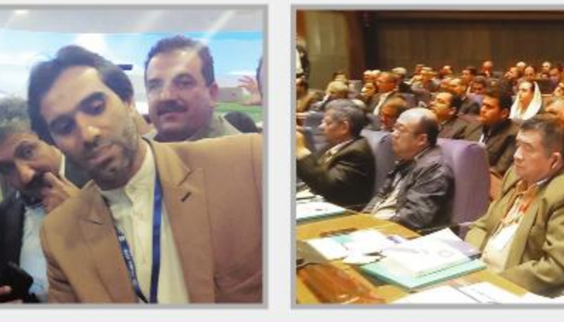
رئیس کل بانک مرکزی کشور میزبان سرمایه گزاران داخلی و خارجی بود.