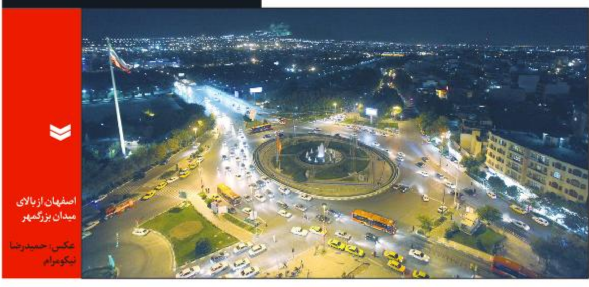
اصفهان از بالای میدان بزرگمهر