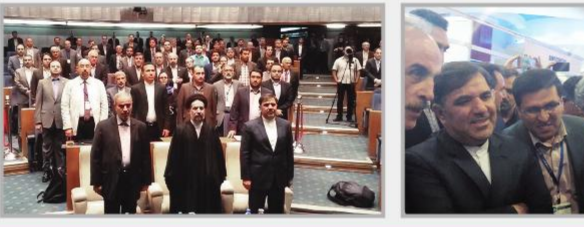
معاون اول رئیس جمهور در این همایش بین المللی حضور داشت و با سرمایه گزاران داخلی و خارجی گفتگو کرد.

قرار است ایران با رشد اقتصادی هشت درصدی رتبه نخست اقتصادی در منطقه را بدست آورد تا ضمن افزایش رفاه مردم اشتغال پایدار نیز در کشور عملی شود