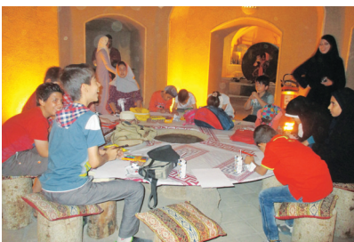
راجع به کار کرد موزه و تاریخچه آن برایشان تدارک دیده شده است و علاوه بر آن اجزای موزه برایشان تشریح می شود

و بعد از آن ضمن پذیرایی در فضایی مفرح آنچه از میدان تا موزه برایشان تعریف و بازنمایی شده را در قالب نقاشی تصویر می کنند. در پایان نیز با برنامه بازدید از بازار شمشیرسازان و سماور سازها به همراه دو هنرمند شاه عباس و تلخک گردشگری شان به پایان می رسد.