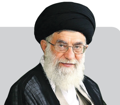
رهبر معظم انقلاب در دیدار اعضای مجلس خبرگان رهبری:

مسوولان به اظهارات بسیار بد مقامات آمریکار سما پاسخ دهند