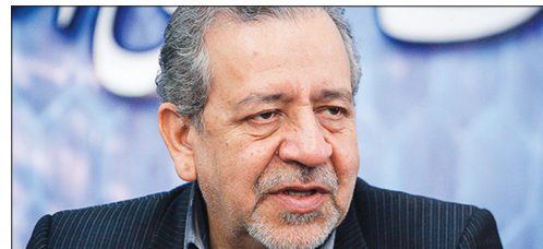
مدرک گرایبی، مسیر اصلی آموزش را منحرف کرد