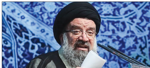
اروپایی‌ها اگر می‌خواهند به ایران برگردند توبه نصح کنند

شنبه ۱۰ مرداد ۹۴ ۱۵ شوال ۱۴۳۶ | ۱ آگوست ۲۰۱۵ | شماره ۲۴۲۸ | ۱۲ صفحه | ۵۰۰ تومان