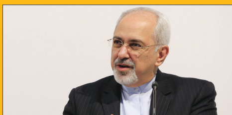
گسترش روابط با بغداد جزو اولویت های ایران است ایران ۲