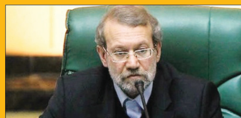
همه افراد باید نسبت به هشدار رهبری درباره نفوذ آمریکا حساس باشند ایران ۷