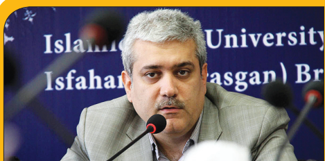
آماده تامین اعتبار برای ایجاد کریدور علم و فناوری اصفهان هستیم خبر ۴