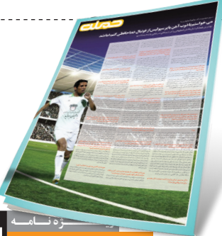
معاون اول رئیس جمهور: