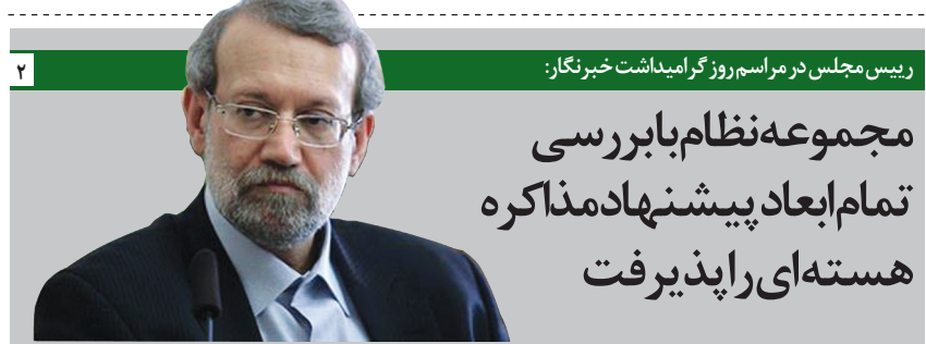
رئیس مجلس در مراسم روز گرامیداشت خبرنگاران:

مجموعه نظام با بررسی تمام ابعاد پیشنهاد مذاکره هسته‌ای را پذیرفت