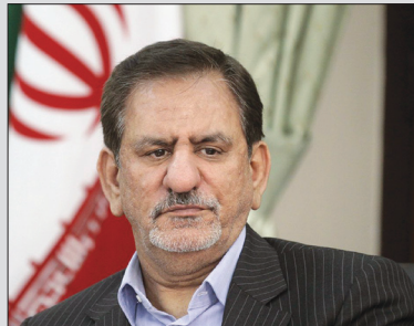
رئیس شورای اسلامی شهر اصفهان: