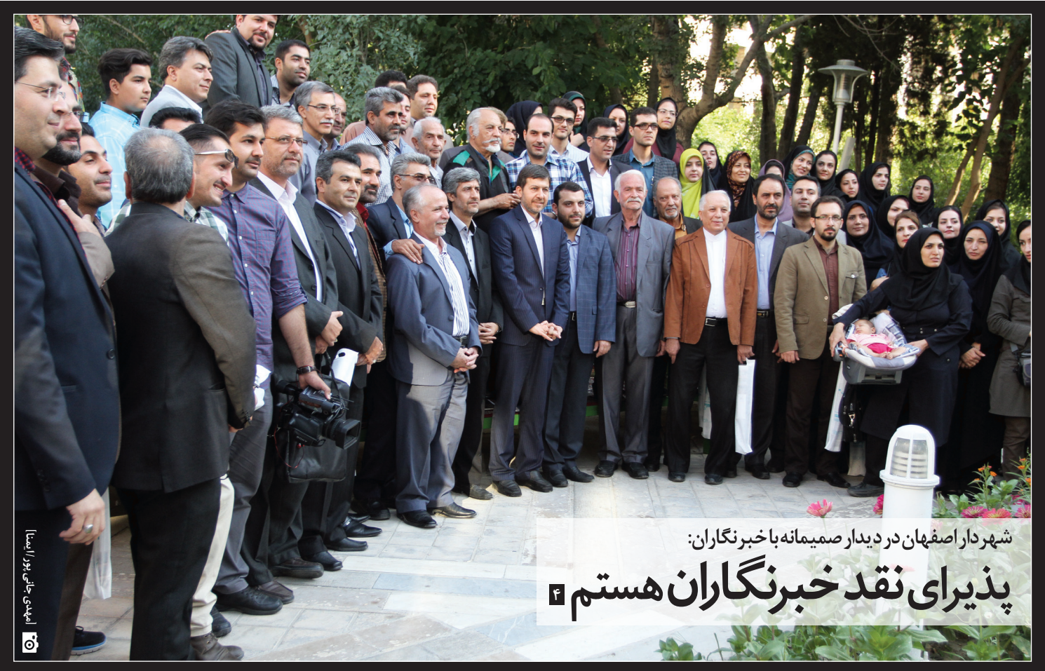
شهردار اصفهان در دیدار صمیمانه با خبرنگاران:

استاندار با اشاره به رفع نیازهای واحدهای صنعتی: