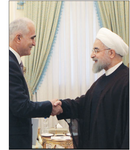
رئیس‌جمهور و وزیر امور خارجه ایران در دیدار با رئیس‌جمهور آذربایجان

وی با بیان اینکه انتصابات وزارت کشور بر مبنای این بوده است که