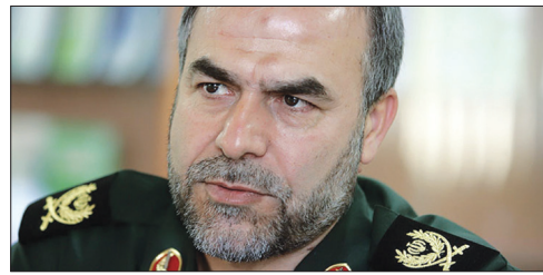
آمریکاجرات عملیاتی کردن تهدیداتش را ندارد