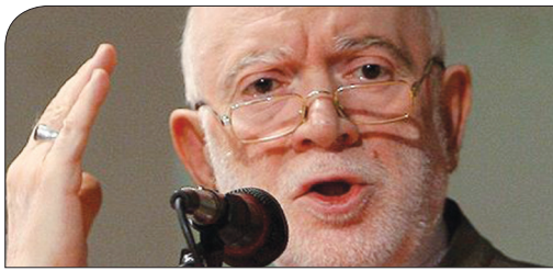
تعمیل در تصویر بر جام خلاف احتیاط است