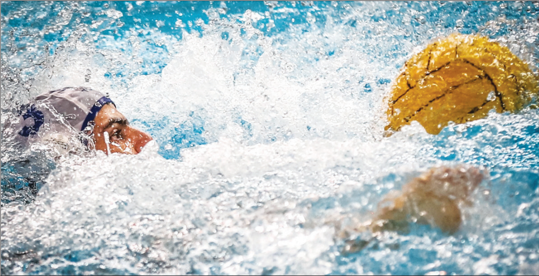
تیم واترپلو سپاهان در حین تمرین