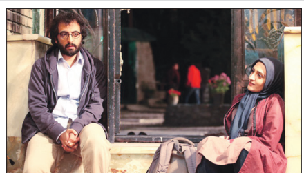
علت فضای جاسوسی به شکل سیاه و سفید به روی آنتن خواهد رفت.