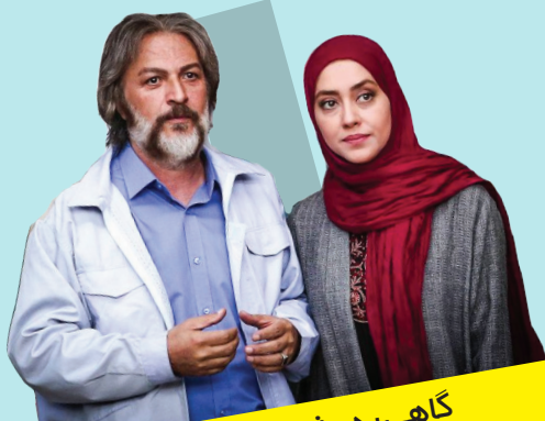
گاهی به پشت سر نگاه کن