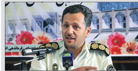
ادعای شناسایی عامل اسیدپاشی واقعیت ندارد ۸