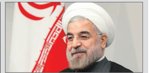
با کمک به یکدیگر و حمایت مردم از مشکلات عبور خواهیم کرد ۷