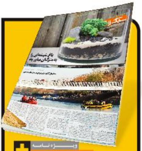
توسعه و عمران شهر متوقف نمی‌شود

عمران سهمی ۲۰۰۰ میلیارد تومانی از بودجه ۹۴ اصفهان دارد و همزمان با احداث ۵ تقاطع غیر همسطح، اجرای پروژه‌های شاخص اصفهان تا رسیدن به خط پایان تداوم می‌یابد. اجرای پروژه‌های عمرانی در شهر از مهم‌ترین وظایف شهرداری هاست و سهم بزرگی از بودجه هر سال شهرداری را