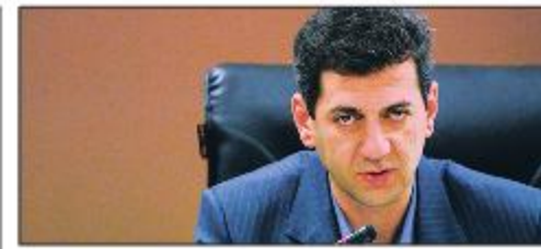
معاون عمران شهری شهرداری اصفهان: آسفالت معابر اصفهان تا سال ۹۵ ساماندهی می شود

با آزاد سازی ۴۶۰ هکتار، چهارمین حلقه ترافیکی اصفهان شکل می گیرد امسال ۴ تقاطع غیر همسطح حلقه چهارم ترافیکی احداث می شود