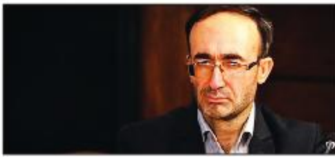
دادستان عمومی و انقلاب اصفهان در حمایت نسیم مهز: یک سوم خانواده زندانیان کشور تحت پوشش حامیان اصفهانی هستند