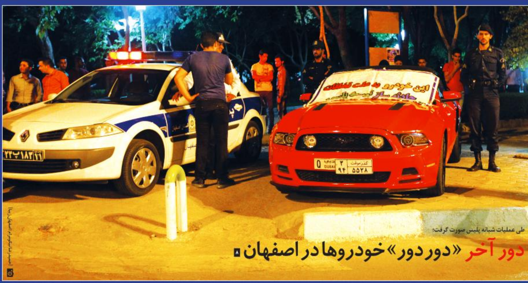
طی عملیات شبانه پلیس صورت گرفت: