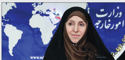
برنامه هسته‌ای ایران در چارچوب قوانین بین‌المللی است ایران ۲

پنجشنبه ۲۱ خرداد ۹۴ | ۲۳ شعبان ۱۴۳۶ | ۱۱ زوئن ۲۰۱۵ | شماره ۲۳۸۹ | ۱۲ صفحه به همراه ۴ صفحه آگهی | ۵۰۰ تومان