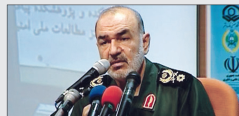
دشمنان به دنبال بی‌هویت سازی ما هستند ایران ۲