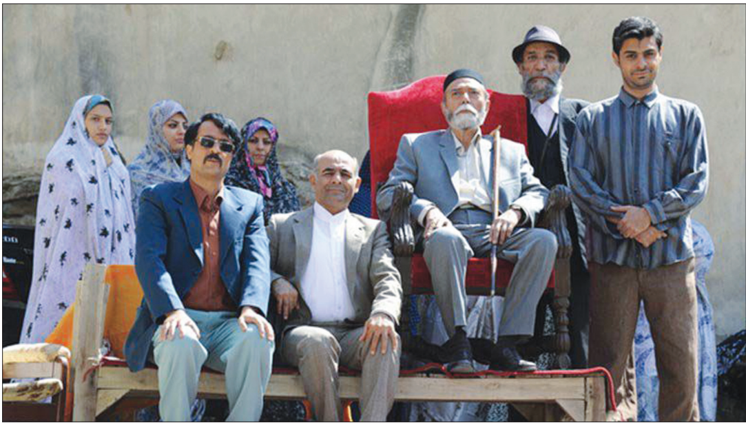
«ایران برگر» حاصل رویکرد جدید دگردیسی

گونه کمدی در ایران است؛ روایت جدیدی از کمدی انتفادی در سینمای ایران که چندان غامض عمل نکرده و نشانه‌ها به، راه راحتی قابلیت رمزگشایی دارد؛ اتفاقی که مطمئنا با بیان کمدی بهتر و راحت تر می‌توان به برخی اتفاقات پرداخت؛ کاری که «ایران برگر» جوزانی به خوبی به آن عمل می‌کند.