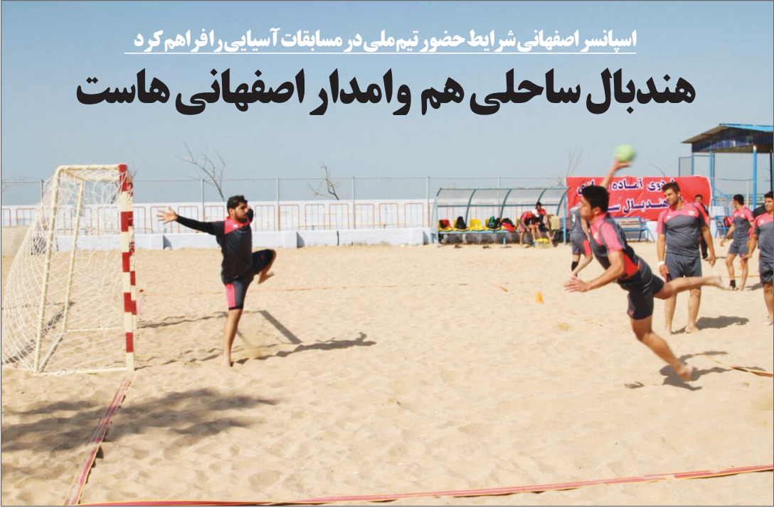
اسپانسر اصفهانی ش رباط حضور تیم ملی در مسابقات آسیایی را فراهم کرد

وی در این خصوص می گوید: تیم پاکستان قدرتمند ترین تیم آسیا محسوب می شود و در اولین گام به دیدار این تیم خواهیم رفت. دیدار با تیم های قطر، عمان و بحرین حساسیت زیادی ندارد و می توانیم از پس این تیم ها بر بیاییم اما کار اصلی ما در مسابقه با تیم های پاکستان و ویتنام است.