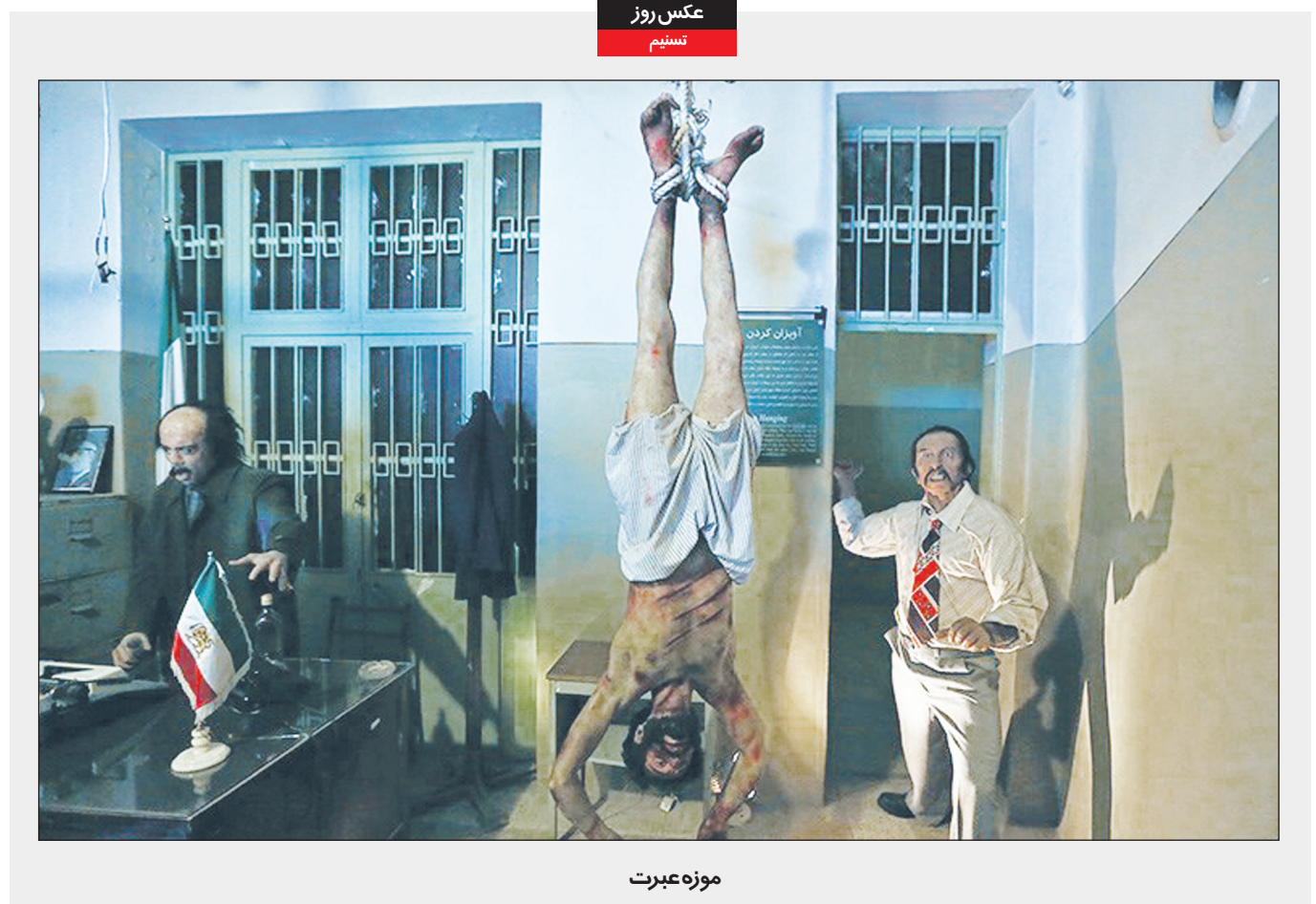
عکس روز: تصویر موزه عبرت

هرگاه چیزی مخالف قانون مطبوعات در آنها مشاهده شود، نشر دهند یا نویسنده بر طبق قانون مطبوعات مجازات می شود اگر نویسنده معروف و مقیم ایران باشد ناشر و طابع و موزع از تعرض مصون هستند، مقرر می شود طبع کتب و روزنامه‌جات و اعلانات دست کم پنج بار به کلی تغییر کرده و متن جدیدی جایگزین آن شود که البته این امر، غیر از اصلاحیه‌ها و متمم‌های مکرر است. آزاد است هر کس بخواهد مطبوعه دایر نماید یا کتاب و جریده و اعلاناتی به طبع برساند یا مطبوعات را بفروشد باید بدو عدم تخلف از فصول این قوانین را نزد وزارت معارف به انضمام شرعی ملتزم و متعهد شود. «این قانون به گفته دست‌انکاران، دست کم پنج بار به کلی تغییر کرده و متن جدیدی جایگزین آن شده که البته این امر، غیر از اصلاحیه‌ها و متمم‌های مکرر است.