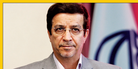
بهره برداری از ۱۰۰ طرح منطقه ۱۲ در اردیبهشت ماه