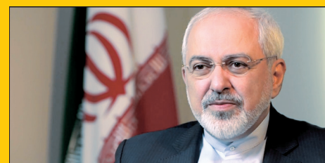
تدوین فکت شیت ایرانی در دستور کار