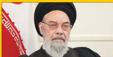
ساماندهی بستر رودخانه مورد توجه قرار بگیرد