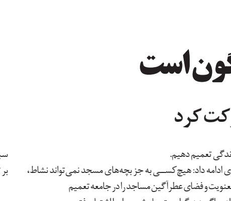
سبک همان تلاوت هنری یک متن زیبا برای الهی بوده که البته علاوه بر تلاوت قرآن و رعایت تمامی اصول فنی، آذان و مدیحه‌سرایی نیز ترکیبی از مضامین بلند و مفاهیم ارزشی که با آن عجين شده است.

حاکمیت فضای معنوی مسجد بر عرف اجتماعی بهترین مسیر برای نجات جامعه از ورطه انحراف بوده و باید شور و نشاط معنوی را به ابعاد دیگر زندگی تعمیم دهیم.