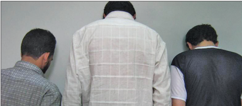
با تلاش کارآگاهان پلیس آگاهی استان اصفهان در عملیاتی ویژه و ضربتی فردی که اقدام به سرقت داخل خودروهای پارک شده در خیابان های سطح شهر می کرد دستگیر و به ۶۴ فقره سرقت اعتراف کرد.

سرهنگ ستار خسروی، رییس پلیس آگاهی استان اصفهان اظهار داشت: سرقت داخل خودرو همیشه به عنوان یکی از دغدغه های مسوولان نیروی انتظامی بوده و این موضوع در قرارگه مبارزه با سرقت با جدیت مطرح و در این خصوص طرح های مقابله ای در دستور کار کارآگاهان پلیس آگاهی استان قرار گرفت. وی افزود: در یکی از این طرح های انجام شده، سارق داخل خودرو که به صورت حرفه ای در غرب شهر اصفهان اقدام به سرقت داخل خودرو می کرد شناسایی و در مخفیگاه خود دستگیر شد. این مقام مسوول با بیان اینکه متهم معناد و دارای سابقه کیفری نیز است، اظهار داشت: با اعترافات سارق ۶۴ فقره سرقت داخل خودرو در شهر اصفهان که توسط وی انجام شده بود کشف و مالباختگان آنها نیز شناسایی شدند. سرهنگ خسروی با بیان اینکه سارقان معناد، عمدتاً خودروهای