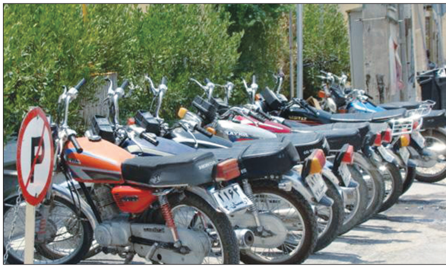
رئیس پلیس راهور اصفهان:

با یادآوری اعلام ناگهانی پیروزی انقلاب اسلامی در ۲۲ بهمن ۵۷، اشغال ناگهانی لانه جاسوسی آمریکا، شروع غیر مترقبه جنگ تحمیلی و تصمیم یک طرفه قدرت‌های غربی به تحریم ایران و همچنین آزادی جاسوسان آمریکایی (لانه جاسوسی)، اعلام ناگهانی پذیرش قطعنامه ۵۹۸ و شرایط کنونی کشور که همه بخش‌ها مناسبانه فعالیت‌های خود را منوط و موقوف به لغو تحریم‌ها کرده‌اند، لذا برنامه ریزی‌های پیشگیرانه از بحران‌های تحمیلی پس از لغو تحریم‌ها توسط بانک مرکزی و تیم اقتصادی دولت، اجتناب ناپذیر است که در زیر با نیم‌نگاهی به شرایط موجود، نکاتی در مسیر و راه‌حلی برای برون رفت از این شرایط و آمادگی لازم برای شرایط پس از لغو تحریم‌ها، از نگاه و نظر صاحبان نظر می‌گذرد. دکتر ولی‌الله سیف، رئیس بانک مرکزی در تاریخ ۲۶ آبان ۱۳۹۳ در نشست اعضای اتاق ایران حضور یافت و در این نشست به دفاع از سخنان خود در دوم مهرماه سال گذشته پرداخت. در شرایطی که پس از انتخابات سال ۹۲، اقتصاد ایران وارد شوک مثبت روانشناختی شد؛ سخنانی که در هنگام روند نزولی قیمت دلار بیان کرد و باعث شد این روند متوقف بشود: «هیچ دلیلی برای کاهش بیشتر نرخ دلار در بازار آزاد وجود ندارد و اصلان منطقی نیست»