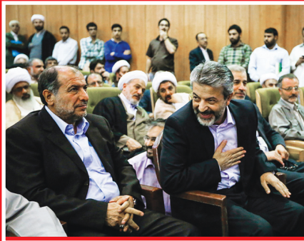
نشست همگرایی اصولگرایان گزارشی تصویری از