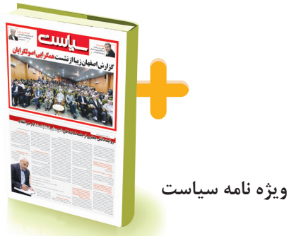
ویژه نامه سیاست

شهردار اصفهان با اشاره به لزوم مشارکت شهروندان در اداره شهر: