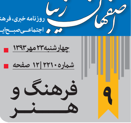
فرهنگ و هنر