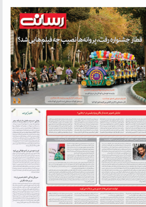
ویژه نامه رسانه

اجلاس اصفهان نقطه عطفی در پاسداری از میراث فرهنگی ناملموس است ۳