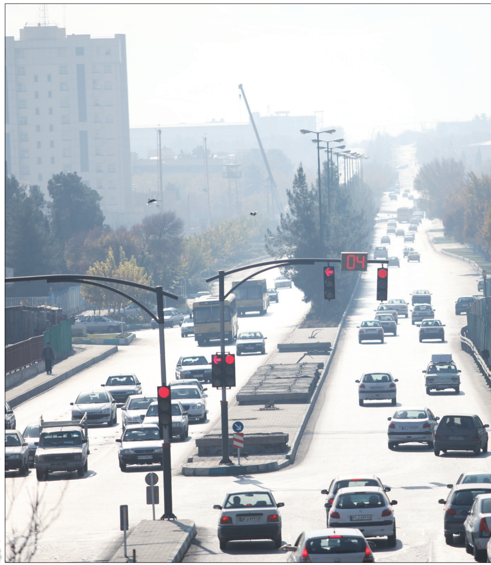
بنزین یورو چهار آلودگی اصفهان را به یک سوم کاهش می‌دهد

۱۱ برای ساکت کردن ایوب‌سیون ها یا ... یکی قرمز، یکی آبی