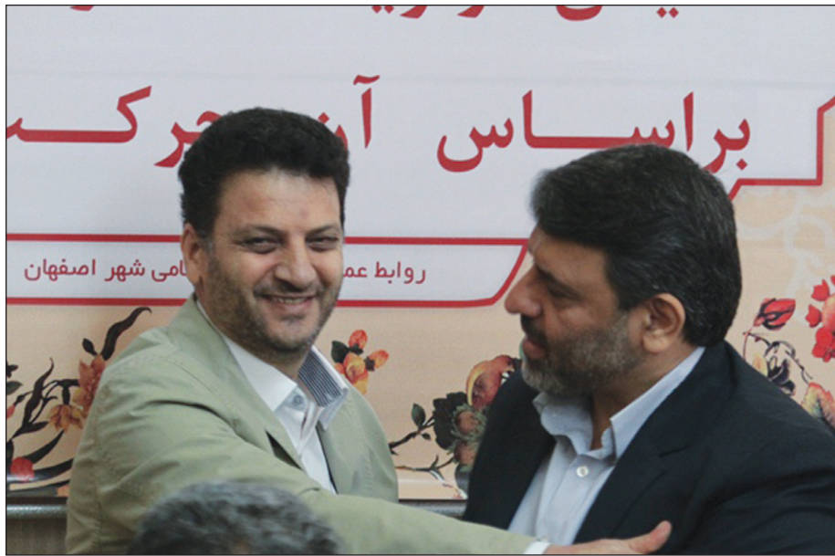
با کسب ۱۱ رای رضامینی در مقابل ۱۰ رای ابوالفضل قربانی