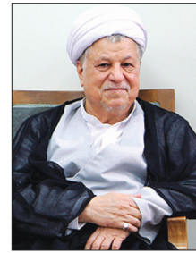
۲ هزیمت تاریخی اسرائیل شروع شده است