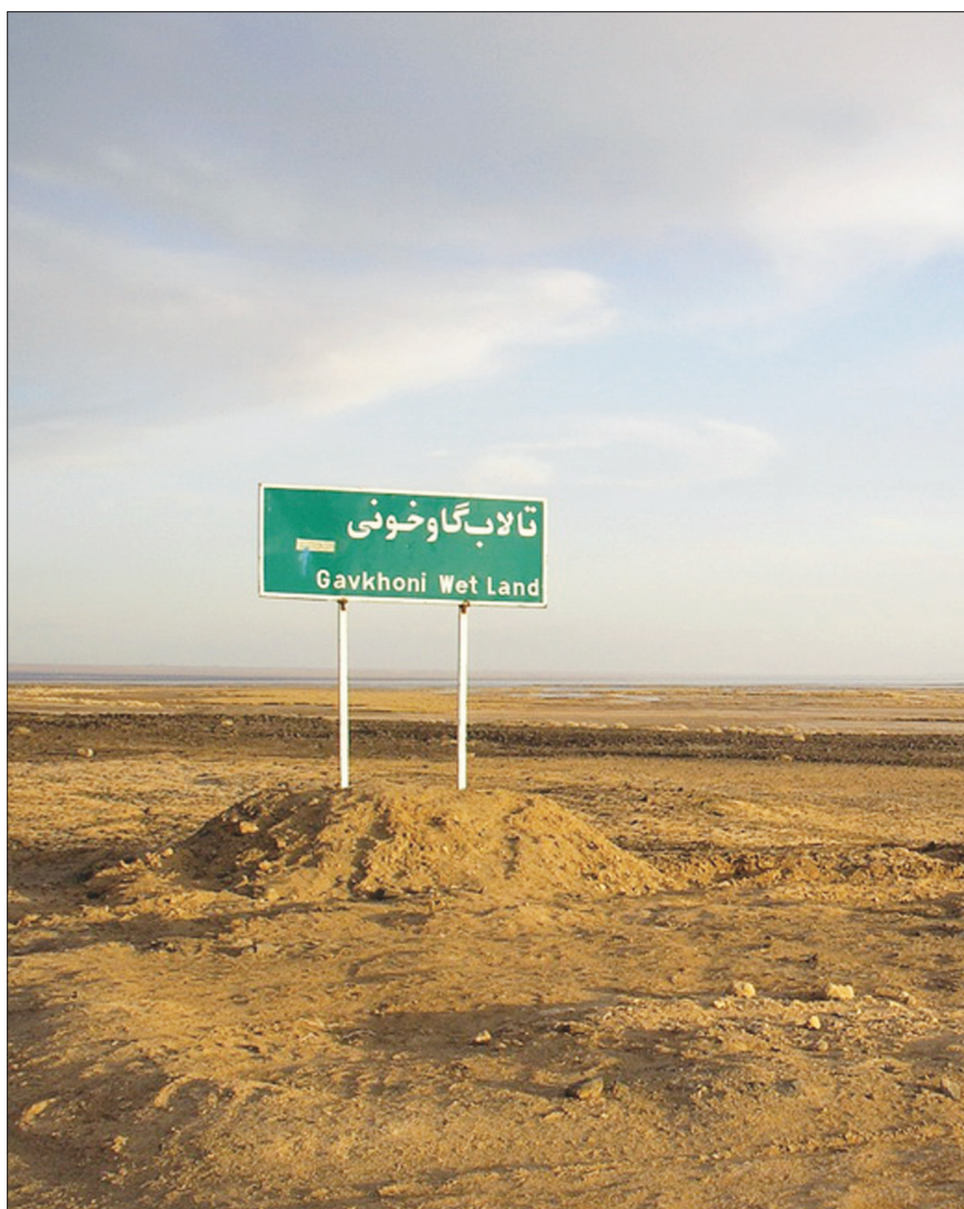
پیگیری مجدد احداث تونل بهشت آباد در دستور کار وزارت نیرو