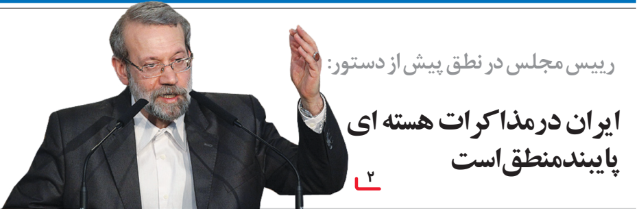
۲ رییس مجلس در نطق پیش از دستور:

روزنامه خبری | دوشنبه ۳۱ شهریور ۱۳۹۲ | ۲۶ ذی القعدة ۱۴۳۵ | شماره ۲۱۹۳ | www.isfahanziba.ir | ۳۰۰۰۴۸۳۰۸۸ | پیامک: ۳۰۰۰۴۸۳۰۸۸ | صفحه | قیمت: ۳۰۰۰ تومان | تومانی | info@isfahanziba.ir