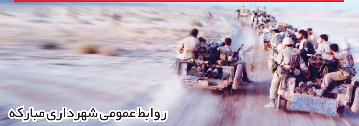
روابط عمومی شهرداری مبارکه