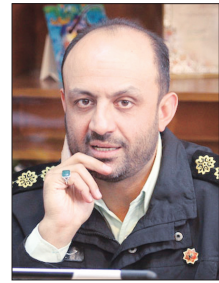
۶ مهر را بامهر آغاز کنیم