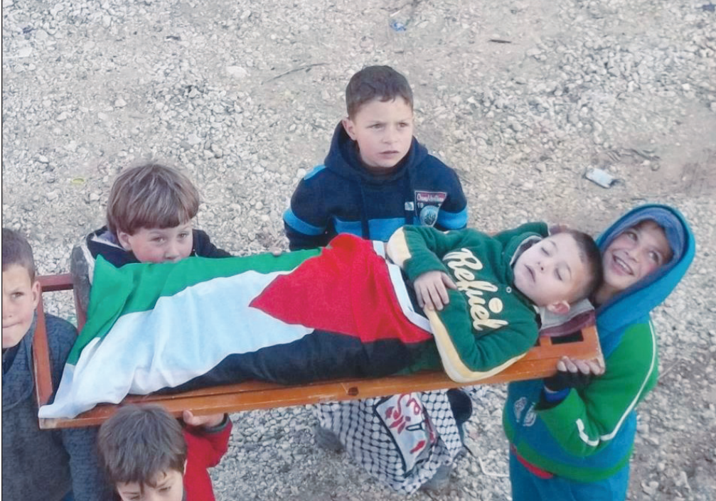
یکی از بهترین کاریکاتورهای این روزها شهادت بازی کودکان فلسطینی در غزه

درسته که بعضی وسایل به مرور زمان کارایی خودشان را از دست می دهند. اما گروهی خلاق هم هستند که بعضی نام ها را هرگز فراموش نمی کنند و آن را روی یک بازی ساده، خفن و حتی خنده دار هم می گذارند. شاید خیلی از شما تاکنون بازی جذاب «آفتابه» را برای نصب روی گوشی همراهتان از بازار دانلود کرده باشید. اگر این طور است که لذت حدس زدن، و به دست آوردن یک کلمه از میان تصاویر و حروف بی ربط را کشف کرده اید. اما اگر از این دسته نیستید قبل از هر کار سری بریزید به سایت http://cafebazaar.ir و از قسمت بازی های برتر آفتابه را بگیرید. یک برنامه باحال، سرگرم کننده و دور همی. شما توی این بازی ساده، یک عبارت تقریباً بی ربط را از روی عکس هر مرحله حدس می زنید. مثلاً در کارت اول یک کمان رنگی رنگی می بینید حالا شما حدس می زنید که این «نکین کمان» است. یا مراحل پیشرفته تر تعدادی بره را در حال چرا می بینید که با کمی فسفر سوزاندن می توانید «چنبیره» را کشف کنید. شما با هر حدس زدن صبح ۳۰ امتیاز به دست می آورید. وقتی امتیازاتان بالا رفت می توانید از قسمت راهنمای آن هم کمک بگیرید. مثلاً با کسر ۴۰ امتیاز چند حرف کسر شود یا با دادن ۵۰ امتیاز یکی از حروف را به شما بگوید. حوصلتان باشد تا اول را در دست حدس نزدیک قفل بعدی برای شما نامی شود! با خرید سکه می توانید توی مراحل راهنمایی بگیرید و راحت تر بازی کنید.