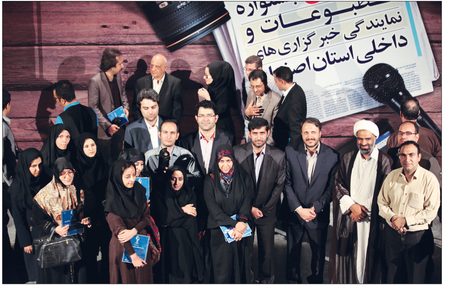
درخشش دوباره اصفهان زیبا با کسب ۲۷ رتبه برتر