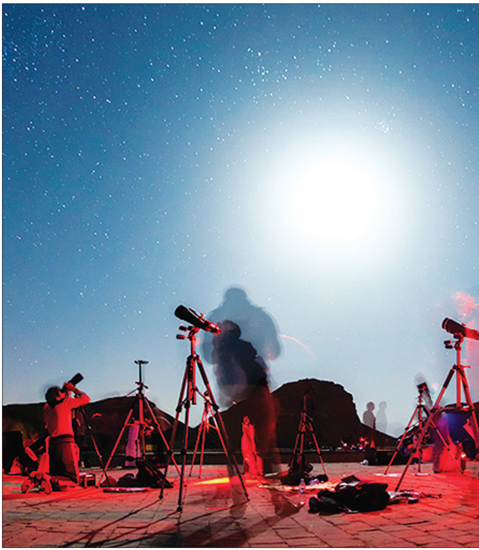
مرکز نجوم ادیب برگزار می کند:

ما هرگز نمی توانیم اتوبیوگرافی صادقانه داشته باشیم