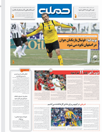
ویژه نامه حمله

گشت رصدی، عکاسی و طبیعت گردی در روستای هونجان